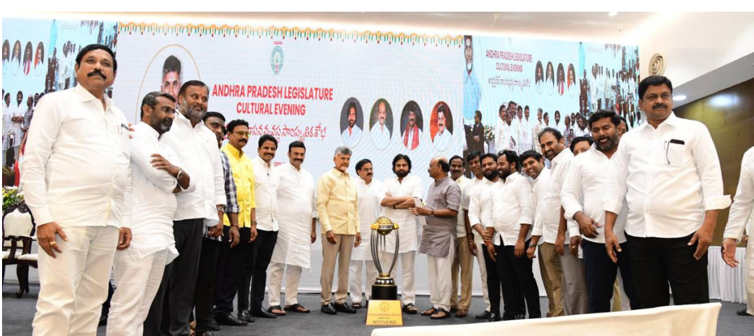
ముఖ్యమంత్రి నారా చంద్రబాబు నాయుడు ఏ కన్వెన్షన్లో ఎమ్మెల్యేలు, ఎమ్మెస్సీలు పాల్గొన్న సాంస్కృతిక కార్యక్రమాలకు హాజరయ్యారు. ఈ కార్యక్రమంలో ఉపముఖ్యమంత్రి, స్పీకర్ డిప్యూటీ స్పీకర్ ఎమ్మెల్యేలు, ఎమ్మెస్సీలు తదితరులు పాల్గొన్నారు.