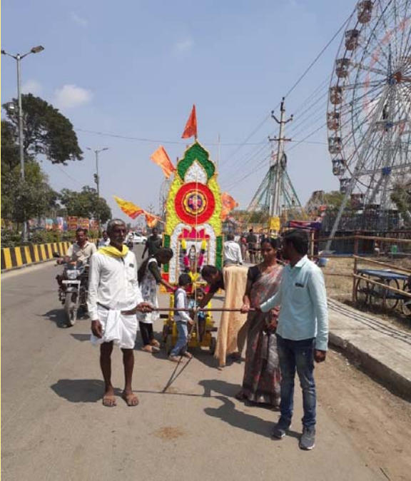
ఆంధ్రప్రదేశ్ రాష్ట్రంలో ఎన్నో ఆశ్చర్యకరమైన ప్రదేశాలు ఉన్నాయి. వాటిలో ప్రముఖంగా చెప్పుకోదగ్గ ప్రదేశాల్లో కోటప్పకొండ ఒకటి. శివుడు దక్షిణామూర్తిగా కొలువైన ఈ కొండపై కాకులు వాలకపోవడం విశేషం.