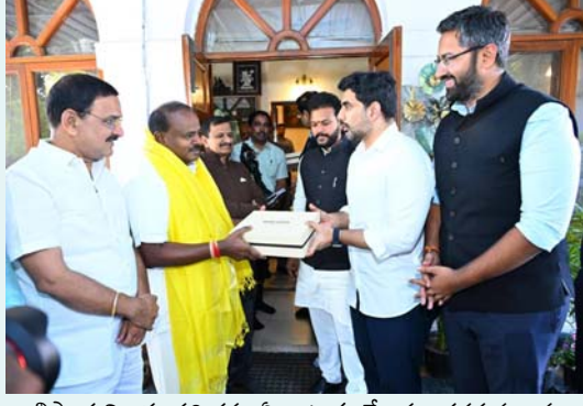
లభిస్తాయని, ఈ పరిశ్రమ ఏర్పాటుకు కేంద్రం తరఫున అవసరమైన అనుమతులను త్వరితగతిన మంజూరు చేయాలని కోరారు.