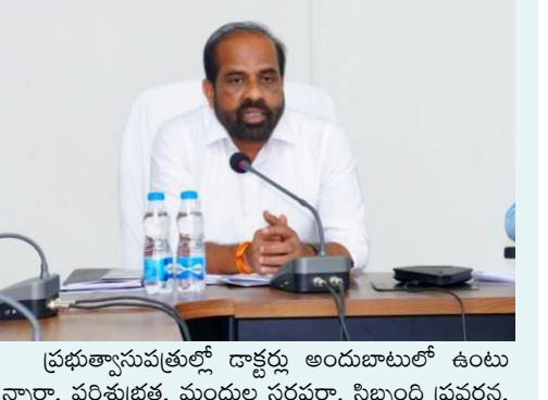
ప్రభుత్వసంస్థల్లో డాక్టర్లు అందుబాటులో ఉంటున్నారు, పరిశుభ్రత, మందుల సరఫరా, సిబ్బంది ప్రవర్తన, అవినీతి తదితర అంశాలపై మిగతా.. 2లో