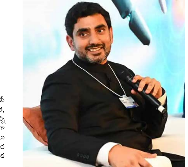
ముఖాముఖి సమావేశాలు నిర్వహిస్తూనే మరోవైపు 8 రౌండ్ టేబుల్ సమావేశాలకు హాజరై ఆయా రంగాల్లో ఆంధ్రప్రభుత్వ విధానాలపై తమ గళాన్ని విన్పించారు. మిగతా.. 2లో