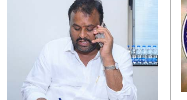
చంద్రబాబు నాయుడు నాయకత్వంలో పనిచేస్తున్న కూటమి ప్రభుత్వం ఇటువంటి సంఘటనలను ఉపేక్షించదని హెచ్చరించారు.

కడప: కడప రవాణా శాఖలో కీచక అధికారిపై వేటు పడింది. ఈ మేరకు మంత్రి రాంప్రసాద్ రెడ్డి చర్చలు తీసుకున్నారు. ఈ సందర్భంగా ఆయన మాట్లాడుతూ బాధిత మహిళలకు అండగా ఉంటామన్నారు. రవాణా శాఖకు కీర్తి తెచ్చేలా నిధులు నిర్వహించాలని ఉద్యోగులకు మంత్రి హితవు పలికారు. ఉన్నత అధికారి ఉండి అసభ్య కార్యకలాపాలకు పాల్పడుతూ మహిళా ఉద్యోగుల పట్ల లైంగిక వేధింపులకు పాల్పడటంపై రవాణా శాఖ మంత్రి తీవ్ర అసహనం వ్యక్తం చేశారు. ఈ ఘటనపై ఆ ఉన్నత అధికారిని తక్షణమే నిధుల నుండి తొలగించి కేంద్ర కార్యాలయానికి సరెండర్ చేశామని, ఒక సీనియర్ అధికారి ద్వారా సమగ్ర విచారణ తక్షణమే చేపట్టి శాఖపరమైన ప్రాశుక్తిక చర్యలు తీసుకుంటామని మంత్రి మీడియాకు తెలిపారు. సీఎం