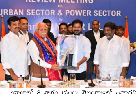
జనాభాలో 8 శాతం ప్రజలు తెలంగాణలో ఉన్నారని కేంద్రమంత్రికి సీఎం తెలియజేశారు. పీపిఎంవై (యూ) పట్టణాభివృద్ధి, విద్యుత్ శాఖలపై కేంద్ర మంత్రి మనోహర్ లాల్ ఖట్టర్ మిగతా.. 3లో