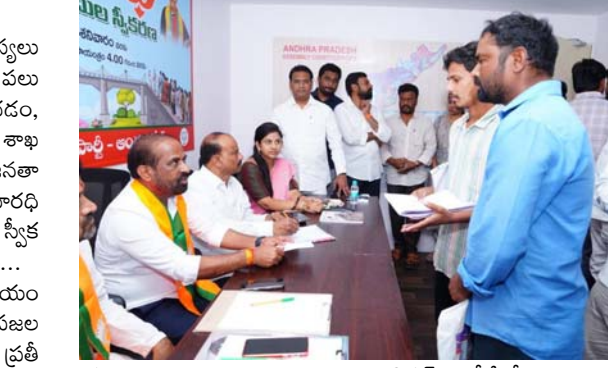
గత ప్రభుత్వం కారణం. సిద్దార్థ మెడికల్ కాలేజీలో విద్యార్థినుల హాస్టల్ లేదు. పీ4 మోడల్లో మెడికల్ కాలేజీలు వచ్చిన దానికి తగిన ఫ్రీ సీట్లు ఉంటాయి.

విజయవాడ, మహానాడు: రెవెన్యూ సదస్సులతో సమస్యలు తగ్గుతున్నాయి. నేషనల్ హెల్త్ మిషన్ ని పొడిగించడం ద్వారా పలు లాభాలు కలుగుతున్నాయి.. కేసీఆర్ పరీక్షలు నిర్వహించడం, వ్యాపక గురించి చర్చలు తీసుకుంటున్నామని వైద్య ఆరోగ్య శాఖ మంత్రి వై.సత్యకుమార్ యాదవ్ తెలిపారు. ఇక్కడి భారతీయ జనతా పార్టీ(బీజేపీ) రాష్ట్ర కార్యాలయంలో శుక్రవారం నిర్వహించిన వార్షిక కార్యక్రమంలో ఆయన పాల్గొని, పలు ఫిర్యాదులు, వినతులు స్వీకరించారు. ఈ సందర్భంగా మీడియాతో ఆయన ఏమన్నారంటే.. అన్ని స్థాయిల్లోని పద్ధతి ప్రకారం అన్ని పదవుల నిర్ణయం ఉంటుంది. అధికారంలో భాగస్వామ్యం ఉంది కనుక ప్రజల సమస్యలు తీర్చడంలో ముందున్నాం. సూర్యపేట ద్వారా ప్రతి ఇంటికి ఆదాయ వసరగా మార్చే పనులు చేస్తున్నాం. నిత్యం ప్రజలలోకి వెళ్ళాలి.. 2030 నాటికి 500 గిగావాట్ల విద్యుత్ ఉత్పత్తి చేసేందుకు ప్రయత్నం చేస్తున్నాం. పీపీపీ మార్గ లో మెడికల్ కాలేజీలు తేవాల్సిన పరిస్థితికి గత ప్రభుత్వం కారణం. 800 కోట్లు మాత్రమే మెడికల్ కాలేజీలకి ఖర్చు పెట్టింది గత ప్రభుత్వం. నిధులు సరిగా ఇవ్వకుండా కాలేజీల నిర్మాణం జరగకపోవడానికి