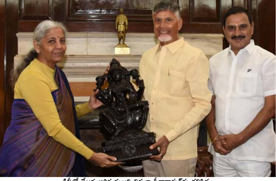
డిల్లీలో కేంద్ర ఆర్థిక మంత్రి నిర్మలా సీతారామన్ కలిసిన ముఖ్యమంత్రి చంద్రబాబు నాయుడు, కేంద్ర మంత్రి భూపతిరాజు శ్రీనివాస వర్మ