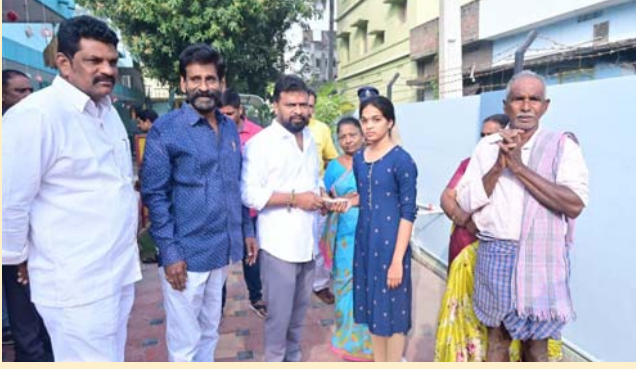
తీసుకురాగా మంత్రి వెంటనే స్పందించి ఆ విద్యార్థినికీ చదువుకు ఖర్చులను సేను చూసుకుంటానని, వెంటనే విద్యార్థిని ఏ ఎం కాల్జీలో హాస్టల్లో చేర్చానని హామీ ఇవ్వడం జరిగింది. తక్షణ సాయం కింద 10వేల రూపాయలు ఆర్థిక సాయం చేశారు.