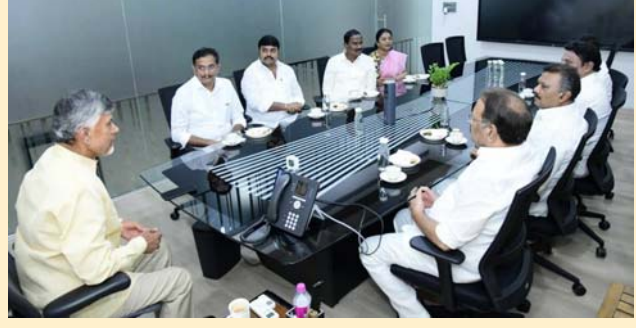
డా.వోస్ పర్యటన ముగించుకొని ఉండవల్లి నివాసానికి చేరుకున్న అనంతరం అందిబాటలో ఉన్న పార్టీ ఎమ్మెల్యేలు, ఎంపీలతో డా.వోస్ అనుభవాలు పంచుకున్న ముఖ్యమంత్రి నారా చంద్రబాబు నాయుడు