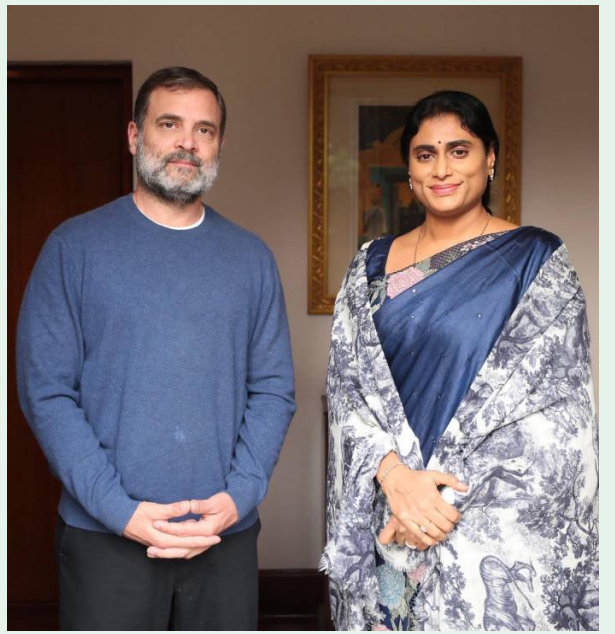
రామలక్ష్మి... షర్మిష్ట భేటి... ఎవరిలో పార్టీ బలోపేతంపై చర్చ...!