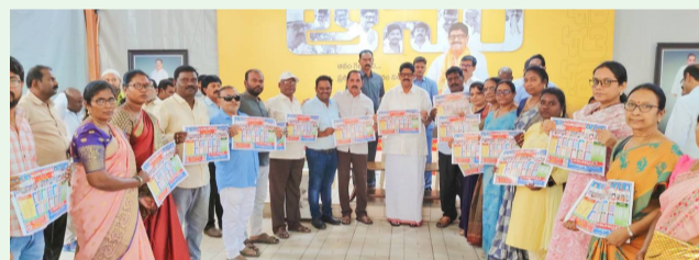
నెల్లూరు నగరంలోని క్యాంపుకార్యాలయంలో ప్రభుత్వ ఉద్యోగుల సంఘం నూతన సంవత్సరం-2025 క్యాలెండర్లను ఆవిష్కరించిన మంత్రి ఆనం