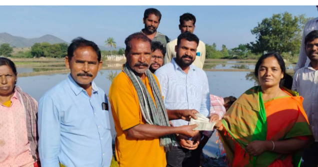
రాష్ట్రాడు నియోజకవర్గం, రామగిరి మండల కేంద్రంలోని ఏక శ్రీ నాగరాజు వ్యవసాయక్షేత్రంలో వరినాట్లు వేస్తున్న పెన్షన్ దారులైన రైతు కూలీలకు ఎస్టీఆర్ భరోసా పెన్షన్లను స్థానిక నాయకులు, అధికారులతో కలిసి పంపిణీ చేసిన అనంతరం అదే వ్యవసాయ పొలంలో వరినాట్లు వేసిన రాష్ట్రాడు శాసనసభ్యురాలు పరిటాల సునీత