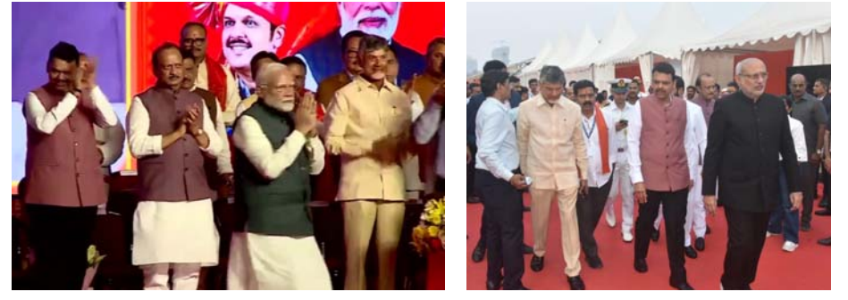
మహారాష్ట్ర సీఎంగా దేవేంద్ర ఫడన్వీస్ ప్రమాణస్వీకారం. ప్రమాణ స్వీకారానికి హాజరైన పవీ సీఎం చంద్రబాబు నాయుడు