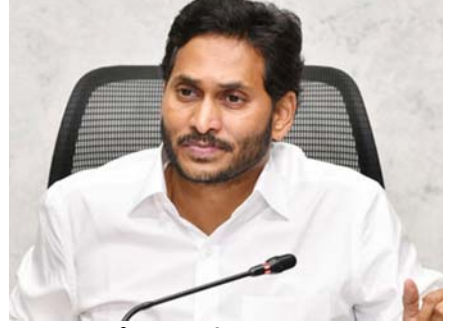
దిశా నిర్దేశం పేరుతో కార్యక్రమం

గ్రామంలో జరుగుతున్న అన్యాయాన్ని ప్రశ్నించాలి. తాడేపల్లి కార్యాలయంలో ఉమ్మడి శ్రీకాళహస్తి జిల్లా చెందిన పార్టీ స్థానిక సంస్థల ప్రజాప్రతినిధులతో సమావేశమైన మాజీ ముఖ్య మంత్రి, వైయస్సార్ల సీనియర్లను వైయస్. జగన్ తాడేపల్లి, మహానాడు: ఈ ప్రభుత్వం పచ్చి దాదాపు ఆరునెలలు కావస్తోంది. ఆరునెలల కాలంలోనే ఇంత తీవ్రమైన వ్యతిరేకత వచ్చిన పరిస్థితులు గతంలో ఎప్పుడూ లేదు. తొలిసారిగా సూచనాం. విచ్చలవిడిగా అవినీతి పెరిగిపోయింది. ఇంకం రేట్లు చూస్తే.. మన కన్నా తక్కు రేట్లకు ఇస్తామన్నారు. మిగతా.. 2లో