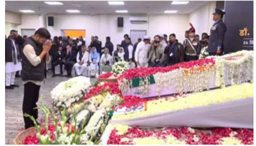
మాజీ ప్రధానమంత్రి మన్మోహన్ సింగ్ కు నివాళులర్పిస్తున్న ముఖ్యమంత్రి రేవంత్ రెడ్డి

పాల్గొన్నారు. కాంగ్రెస్ అగ్ర నేత రావూల్ గాంధీ పాదె మోసారు. అంత్యక్రియలకు రాష్ట్రపతి ద్రౌపది ముర్ము, ఉప రాష్ట్రపతి జగదీష్ ధనఖర్, ప్రధాని నరేంద్ర మోదీ, కాంగ్రెస్ అగ్ర నేతలు మల్లికార్జున్ ఖర్గే, సోనియా గాంధీ, ప్రియాంక