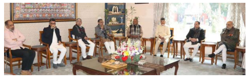
బీజేపీ జాతీయ అధ్యక్షులు జేపీ నడ్డా నివాసంలో ఎన్డీయే నేతల సమావేశం. సమావేశంలో పాల్గొన్న ముఖ్యమంత్రి నారా చంద్రబాబు నాయుడు