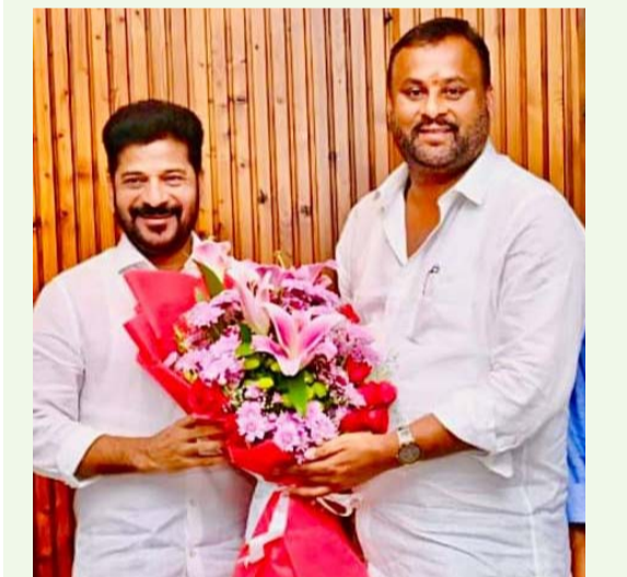
తెలంగాణ ముఖ్యమంత్రి రేవంత్ రెడ్డిని బుధవారం ముఖ్య పూర్వకంగా తన నివాసంలో కలిసి, సత్కరించిన ఏపీ రవాణా, యువజన, క్రీడా శాఖ మంత్రి మండిపల్లి రాంప్రసాద్ రెడ్డి. ఈ సందర్భంగా పలు విషయాలపై చర్చించారు.