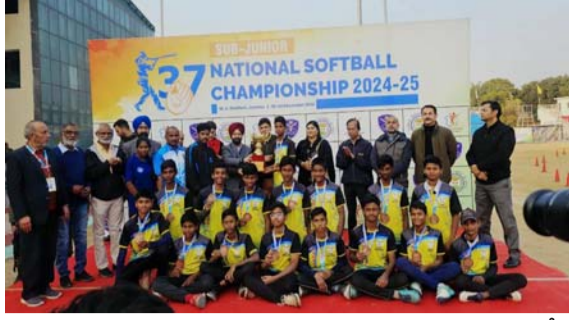
నుంచి, శావ్ నుంచి పూర్తి సహకారం ఉంటుందని హామీ ఇచ్చారు.

జాతీయస్థాయి పోటీల్లో సత్తా చాటి రాష్ట్ర ఖ్యాతిని పెంచడం సంతోషదాయకమని హర్షించారు. భవిష్యత్తులో మరిన్ని వతకాలు సాధించి ఏపీని అగ్రస్థానంలో నిలబెట్టాలని, రాష్ట్ర ప్రభుత్వం