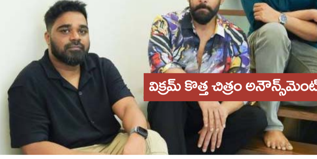
విక్రమ్ కొత్త చిత్రం అనాన్స్ మెంట్