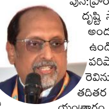
అమరావతి అభివృద్ధి పనులు, పోలవరం ప్రాజెక్టు పనులు పునఃప్రారంభం తదితర అంశాలపై అధికారులు ప్రత్యేక దృష్టి సారించాలి. ప్రజల నుండి పెద్ద ఎత్తున వివరాలు అందు తున్నాయి, వాటిలో చాలా పెండింగ్ లో ఉండిపోతున్నాయి. కాబట్టి ప్రజల సమస్యల పరిష్కారంపై జిల్లా కలెక్టర్లు ప్రత్యేక దృష్టి సారించాలి. రెవెన్యూ, పోలీస్, పంచాయితీ రాజ్, మున్సిపాలిటీ తదితర శాఖలు సర్వీసు డెలివరీ విధానాన్ని జిల్లా యంత్రాంగం ఎంతో మెరుగు పర్చాలి ఉంది. ప్రభుత్వానికి, ప్రజలకు మధ్య వారధిలా ఉంటూ ఎంతో ప్రముఖమైన పాత్రను జిల్లా స్థాయిలో జిల్లా కలెక్టర్లు పోషించాలి ఉంది. అందుకు తగ్గట్టుగా కలెక్టర్లు ప్రోయాక్టివ్ గా పనిచేయాలి.