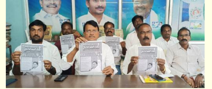
అన్నదాతకు అండగా వైయస్ఆర్ సీపీ, దగాచేస్తున్న కూటమి సర్కార్ పై నిరసన గళం, పోస్టర్ ఆవిష్కరించిన అనగగడ మాజీ ఎమ్మెల్యే సింహారెడ్డి