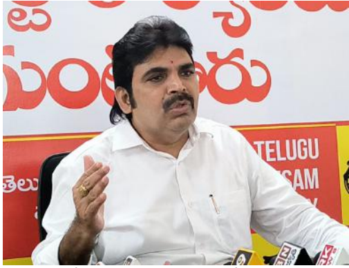
రెడ్డి తన చేసిన అక్రమాలను, కుంభకోణాల నుంచి దృష్టి మళ్లించడానికి కూటమి ప్రభుత్వంపై నిందలు వేస్తున్నారని మండిపడ్డారు. జగన్ నోరు తెరిస్తే అబద్ధాలు మాట్లాడు తున్నారని మండిపడ్డారు.

రాష్ట్ర ఆర్థిక పరిస్థితులు సహకరించకపోయినా ఎక్కడా ప్రజా సంక్షేమానికి ఇబ్బంది కలగకుండా చూస్తున్నామని పేర్కొన్నారు. అన్ని వర్గాల ఆకాంక్షలను నెరవేర్చేందుకు కూటమి ప్రభుత్వం నిరంతరం కృషి చేస్తుందన్నారు. జగన్