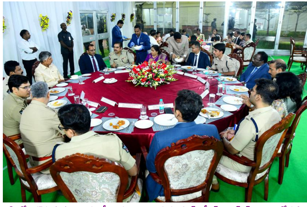
తొలిరోజు కలెక్టర్ల సదస్సు అనంతరం సీఎం చంద్రబాబు నాయుడు ఐఎన్ఎస్, ఐఎస్ఎన్, ఐఎఎఫ్ఎన్ అధికారులతో కలిసి సచివాలయంలో డిన్నర్ చేశారు. జిల్లాల్లోని పలు అంశాలకు సంబంధించి కలెక్టర్లు, ఎస్సీలతో ముచ్చటించారు.