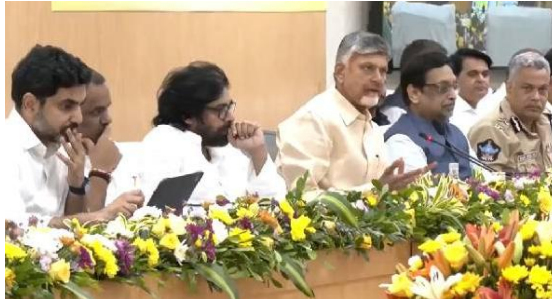
కలెక్టర్ల సదస్సులో అధికారులు ఇచ్చిన ప్రజెంటేషన్ పై ముఖ్యమంత్రి స్పందిస్తూ అధికారులు, కలెక్టర్లకు స్పష్టమైన ఆదేశాలు ఇచ్చారు.

పరిష్కార వేదిక ద్వారా స్వీకరించే ప్రతి సమస్య పరిష్కారం అవ్వాలి అని, ఆర్థికతర సమస్యలు పూర్తి స్థాయిలో పరిష్కారం కావాలని, ఇందులో ఏమాత్రం రాజీపడే ప్రసక్తే లేదని ముఖ్యమంత్రి నారా చంద్రబాబు నాయుడు స్పష్టం చేశారు. ప్రజా సమస్యల పరిష్కార వ్యవస్థ (పీజీఆర్ఎస్) పై