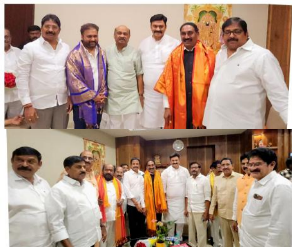
నూతన రాజ్యసభ సభ్యులతో స్పీకర్ అయ్యన్నపాత్రుడు డిప్యూటీ స్పీకర్ రఘురామకృష్ణంరాజు

సంక్షేమ శాఖ మంత్రి డోలా బాల వీరాంజనేయ స్వామి తెలిపారు. నాలుగో డివిజన్ పరలక్ష్మి నగర్ లో రూ. 80 లక్షలతో నిర్మించిన కమ్యూనిటీ హాల్ ను మంగళవారం మంత్రి బాల వీరాంజనేయ స్వామి ప్రారంభించారు. ఈ సందర్భంగా మంత్రి మాట్లాడుతూ అధికారంలోకి వచ్చిన ఐదు నెలల్లోనే ఎస్సీ సబ్ ప్లాన్ నిధులతో ప్రారంభించిన కమ్యూనిటీ హాల్స్ ను జనరల్ నిధులతో పూర్తి చేసి ప్రారంభించడం ఎంతో సంతోషంగా ఉందన్నారు. గత ప్రభుత్వం కమిటీ హాల్స్ ను పూర్తి చేయకుండా నిర్లక్ష్యం వహించారని, రాష్ట్ర వ్యాప్తంగా అసంపూర్ణంగా ఉన్న కమ్యూనిటీ హాల్స్ ను త్వరితగతిన పూర్తి చేస్తామన్నారు. త్వరలోనే రాష్ట్రంలోని మిగతా.. 2లో