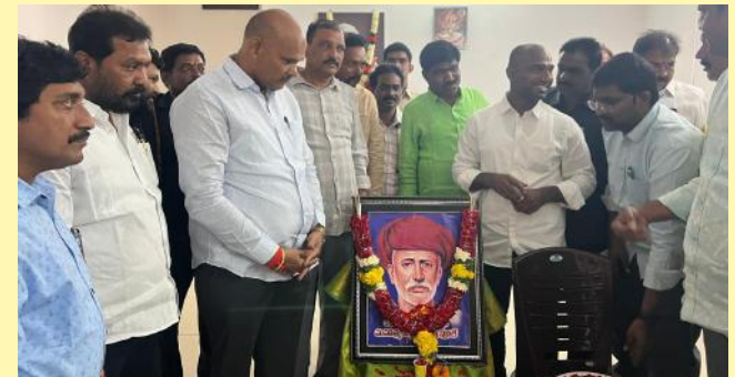
మహానాయుడు, రాష్ట్రపిత జ్యోతిరావు పూలే వర్ధంతి సందర్భంగా, పార్టీ కార్యాలయంలో నివాళులు అర్పించిన గృహ నిర్మాణ మంత్రి సుమాచార, పార్లమెంటు సభ్యులు మంత్రి కిలకం కామన్న కొత్త వ్యవస్థ