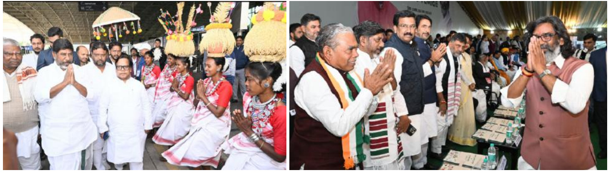
జార్జండ్ సీఎంగా నేడు ఇండియా కూటమి నేత హేమంత్ సోరెన్ ప్రమాణ స్వీకారం. ప్రమాణ స్వీకారం కార్యక్రమానికి డిప్యూటీ సీఎం భట్టి విక్రమారావు ప్రత్యేక అతిథిగా ఆహ్వానించిన జార్జండ్ ప్రభుత్వము. రాంచీ విమానాశ్రయంలో రాష్ట్ర సంప్రదాయం తో ఘనంగా స్వాగతం పలికిన అధికారులు.. ఇండియా కూటమి నేతలు, డిప్యూటీ సీఎంకు కృతజ్ఞతలు.. వాహన కన్వాయి ఏర్పాటు.. సాయత్రం ఇండియా కూటమి ఆధ్వర్యంలో భారీ బహిరంగ సభ.