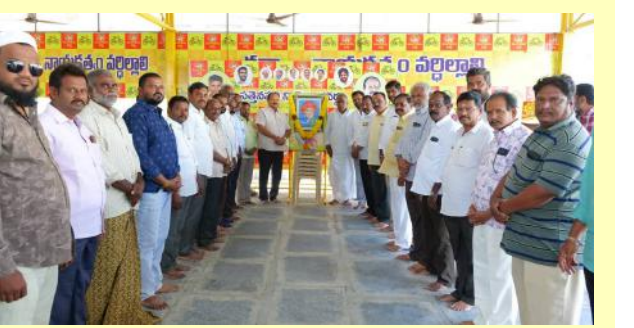
సత్తెనపల్లిలోని రఘురామ నగర్ ఎమ్మెల్యే కార్యాలయంలో గురువారం మహిళా జ్యోతిరావు పూలే వర్ధంతి జరిపారు. ఈ కార్యక్రమంలో ఎమ్మెల్యే కన్నా లక్ష్మినారాయణ పాల్గొని, మాట్లాడారు. సమాజంలో కుల వివక్ష, అంటరానితనంపై నిరంకుశంగా చేసి, బడుగు, బలహీన వర్గాలకు హక్కులు, మహిళా విద్యాభివృద్ధికి కృషి చేసిన ఘనత జ్యోతిరావు పూలే కే దక్కుతుందన్నారు. తొలుత జ్యోతిరావు పూలే చిత్రహానిని పూలమాల వేసి, ఘన నివాళులర్పించారు. ఈ కార్యక్రమంలో వివిధ మేధావర్గాల రాష్ట్ర, జిల్లా, నియోజకవర్గ, పట్టణ, మండల నాయకులు, పాల్గొన్నారు.