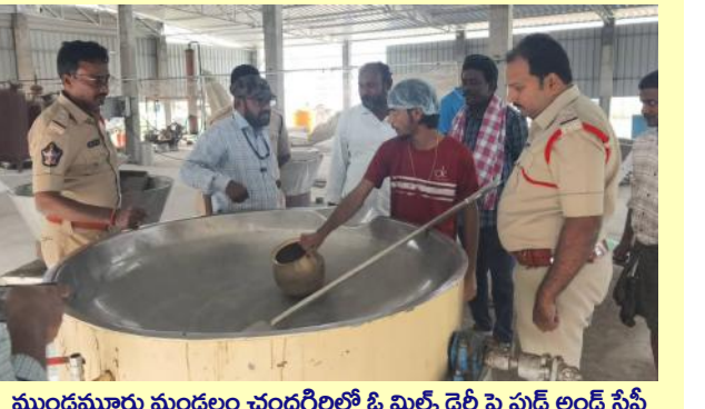
ముండ్లమూరు మండలం చంద్రగిరిలో ఓ.మిల్కెడైరీ ఫుడ్ ఫైట్ అండ్ సస్టీ అధికారులు, పోలీసులు జాయింట్ ఆపరేషన్ నిర్వహించారు. మిల్కెడైరీలో నకిలీపాల పదార్థాలు తయారు చేస్తున్నట్లు చర్యల సమాచారంతో ఆక్ష్మిక తనిఖీని నిర్వహించినట్లు అధికారులు తెలిపారు. పాల పదార్థాల శాంపిల్స్ తీసుకున్నామని, వాటిని ల్యాబ్ కు పంపిస్తున్నామని, ల్యాబ్ రిపోర్ట్ ఆధారంగా వారిపై కఠిన చర్యలు తీసుకుంటామని ఫుడ్ అండ్ సస్టీ అధికారులు తెలిపారు.

విశిష్టమైన చారిత్రక నేపథ్యం కలిగి, అద్భుతమైన ప్రకారాలు, ఆకట్టుకునే ముఖద్వారం, ఎత్తైన రాజగోపురంతో నిడదవోలు మండలం తిమ్మరాజుపాలెంలో ఆలయంనున్న ప్రముఖ మహిమోన్మిత అధ్యాత్మిక పుణ్యక్షేత్రంగా విరాజిల్లుతున్న శ్రీ కోట సత్యమ్మ దేవాలయాన్ని టెంపుల్ టూరిజంలో భాగంగా అభివృద్ధి చేసేందుకు మంత్రి కందుల దుర్గేష్ చర్యలు తీసుకుంటున్నారు. లక్షలాది మంది భక్తుల పాటలు కొంగు బంగారంగా నిలిచి శంఖు వక్ర గగ్గ భద్రం హస్త యజ్ఞోపవీత ధారణిగా ఏకశిలా స్తూపం భూవిగ్రహంతో అలరారుతున్న త్రిశక్తి స్వరూపిణి కోట సత్యమ్మ తల్లి ఆలయాన్ని మరింత అభివృద్ధి చేయాలని భావిస్తున్నారు. అదే విధంగా విశేషమైన మీదుగా గోదావరి నుండి వచ్చే ప్రధాన కాలువను ఆకర్షణీయంగా తీర్చిదిద్ది ఆంధ్రప్రదేశ్ టూరిజం సాగుగా చేసేందుకు మంత్రి కందుల దుర్గేష్ నిర్ణయించారు. పచ్చని ప్రకృతి ఒడిలో ఉన్న కాలువను సర్కూల్ లో భాగంగా అభివృద్ధి చేసి కాలువలో బోట్ డిసార్ ఏర్పాటు చేయనున్నారు. తర్వాత ప్రజలు కాలువ ఒడ్డున ఆహారంగా గోడీపేలా, సేదతీరేలా తీర్చిదిద్దనున్నారు. ఇక వందేళ్లకు పైగా చరిత్ర కలిగిన రాజమహేంద్రవరం హేవలాక్ బ్రిడ్జి అభివృద్ధి ఎన్నో విధంగా ప్రతిపాదనలతో