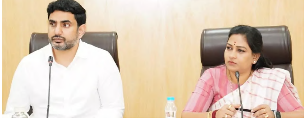
విజయవాడ, గుంటూరు, తిరుపతి ప్రాంతాల్లో 5 స్పెషల్ కోర్టులు లేదా ఫ్యాన్ ట్రాక్ కోర్టుల ఏర్పాటును డిజిపీ పర్యవేక్షించనున్నారు. ఒక్క అమరావతి హెడ్ ఆఫీస్ లోనే 249 మందితో పక్కా నిఘా రక్షణ వ్యవస్థ ఏర్పాటు కానుంది. ఒక్కో నార్కోటిక్ పోలీస్ స్టేషన్ లో 66 మంది సిబ్బంది డిప్యూటీ షిఫ్ట్ లో విధులు నిర్వహిస్తారు. అలాగే, జిల్లావారీగా నార్కోటిక్స్ కంట్రోల్ సెల్ లో 144 మంది విధుల్లో ఉంటారు. మొత్తం 358 మంది అధికారులతో ఈగల్ వ్యవస్థ ఏర్పాటు కానుంది. బెట్ సోల్డింగ్ సిబ్బంది కూడా కలుపుకొని ద్రగ్ నియంత్రణ కోసం మొత్తం 459 మందితో కూడిన ఈగల్ వ్యవస్థ తయారు కానుంది. డిప్యూటీ షిఫ్ట్ పద్ధతిలో 341 మంది, రెగ్యులర్ పద్ధతిలో 17 మందికి విధులు అప్పగిస్తారు. అలాగే, రూ.8.59 కోట్ల ఖర్చుతో

అమరావతి, మహానాడు: ఎలైట్ యాంటి నార్కోటిక్స్ గ్రూప్ ఫర్ లా ఎన్ఫోర్స్ మెంట్ (ఈఎజీఎల్ఈ:ఈగల్) ఏర్పాటు చేస్తూ హెంబుల శాఖ ఉత్తర్వులు జారీ చేసింది. అమరావతిలో ఈగల్ హెడ్ క్వార్టర్స్, ప్రత్యేక నార్కోటిక్ పోలీస్ స్టేషన్ ఏర్పాటు దిశగా అడుగులు వేస్తున్నాయి. ఇందులో భాగంగానే జిల్లాకు ఒక నార్కోటిక్స్ కంట్రోల్ సెల్ ఏర్పాటు చేసేందుకు కూటమి ప్రభుత్వం సన్నాహాలు చేసింది. ఇక నుంచి ప్రజల ఆరోగ్యం, రక్షణ, సామాజిక బాధ్యతలో 'ఈగల్' కీలకంగా వ్యవహరించనుందని ఘావిస్తున్నారు. ఈ వ్యవస్థ ద్రగ్ ప్రతిఘటన సేవల నివారణ, విచారణ, పరిశోధనపై ప్రత్యేక దృష్టి సారించనుంది. నార్కోటిక్స్ పోలీస్ స్టేషన్ హోస్టిల్ ఆఫీసర్ గా డిప్యూటీ సూపరెం టెండెంట్ స్థాయి అధికారి ఉంటారు. డిప్యూటీ షిఫ్ట్ లో అధికారులను నియమించుకోవాలని హెంబుల మార్గదర్శకాలు జారీ చేసింది. శిక్షణను సమర్థవంతంగా పూర్తి చేసి ఈగల్ ఆమోదించాకే డిప్యూటీ షిఫ్ట్ లో పని చేసే ఛాన్స్ ఉంటుందని అందులో పేర్కొంది. ఈగల్ హెడ్ ఆఫీస్, నార్కోటిక్ పోలీస్ స్టేషన్, జిల్లా నార్కోటిక్ కంట్రోల్ సెల్ లో పనిచేసే వారికి విధి నిర్వహణ కాంట్లో 30 శాతం స్పెషల్ అలోవెన్స్ కూడా చెల్లించనున్నారు. ఆంధ్రప్రదేశ్ హైకోర్టు ఆధ్వర్యంలో విశాఖపట్నం, రాజమహేంద్రవరం,