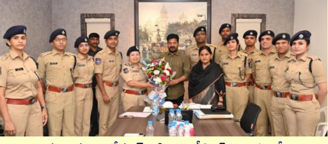
ముఖ్యమంత్రి రేవంత్ రెడ్డిని జూబ్లీహిల్స్ నివాసంలో మర్యాదపూర్వకంగా కలిసిన తెలంగాణ కేడర్లోని 2023 - 2024 బ్యాచ్ లు బ్రెస్ IPS అధికారులు.