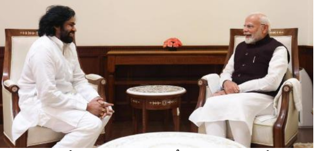
ప్రభుత్వం ఖర్చు చేసినది వివరాలను మోడీకి తెలిపారు. ఖర్చు చేసిన నిధుల వల్ల పూర్తయిన పనులు కూడా ఏ మాత్రం ప్రయోజనం లేకుండా, నాసిరకంగా చేశారని పేర్కొన్నారు. ఢిల్లీలో రెండు రోజుల పర్యటనలో భాగంగా జాతీయ నాయకులు, కేంద్ర మంత్రులను వరుసగా మిగతా.. 5లో

దేశంలోని ప్రతి ఇంటికి స్వచ్ఛమైన తాగు నీరు ఇవ్వాలనే బలమైన సంకల్పంతో రూపొందించిన జల్ జీవన్ మిషన్ పథకం లక్ష్యాలను ఆంధ్ర ప్రదేశ్ లో గత ప్రభుత్వం గాలికొదిలేసిందని, కేంద్ర ప్రభుత్వ ఆశయాలుకు అనుగుణంగా జల్ జీవన్ మిషన్ ప్రాజెక్టును ప్రణాళికాబద్ధంగా ముందుకు తీసుకువెళ్లాలని ఉప ముఖ్యమంత్రి పవన్ కళ్యాణ్ ప్రధానమంత్రి నరేంద్ర మోడీ కి తెలియచేశారు. జల్ జీవన్ మిషన్ పథకాన్ని సద్వినియోగం చేసుకోవడంలో రాష్ట్ర విజ్ఞప్తి గౌరవ ప్రధాని విడుదలం చేశారు. ఆంధ్రప్రదేశ్ లోని మారుమూల గ్రామాల్లో సైతం ప్రతి ఇంటికి కుళాయి ద్వారా మంచి నీరు అందించే జల్ జీవన్ మిషన్ కార్యక్రమం ద్వారా కేంద్ర ప్రభుత్వం రూ. 23 వేల కోట్లను కేటాయిస్తే, దానిలో కేవలం రూ. 2 వేల కోట్లను మాత్రమే గత