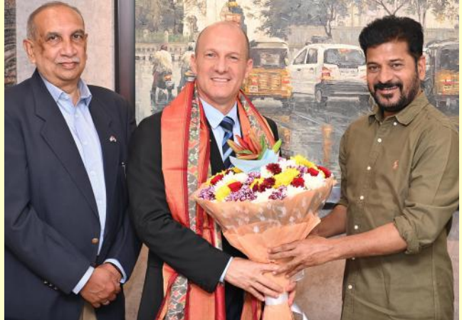
జూబ్లీహిల్స్ నివాసంలో ముఖ్యమంత్రి రేవంత్ రెడ్డిని మర్యాదపూర్వకంగా కలిసిన ఇజ్రాయెల్ రామబాబి రూవెన్ ఆజర్ (Mr.Reuven Azar).