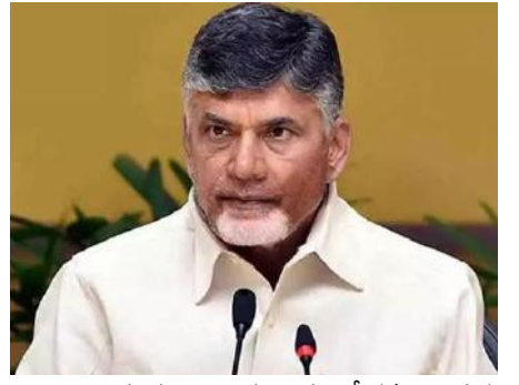
బాబు నాయుడు అన్నారు. ఈ మేరకు ఆయన బుధవారం పార్టీ ఎన్నికల్లో, మిగతా.. 2లో

అన్ని విధాలా దెబ్బతిన్న రాష్ట్రాన్ని గాడిన పెడుతూనే పార్టీ కోసం కష్టపడ్డ కార్యకర్తలకు నామినేటెడ్ పదవులు ఇచ్చారు. సరైన మనిషి... సరైన చోట ఉంచుతామన్న మాటకు కట్టుబడి పార్టీ కోసం క్రమించిన వారిని పదవుల్లో నియమిస్తున్నాం. చరిత్రలో ఎప్పుడూ లేని విధంగా మొన్నటి ఎన్నికల్లో పని చేశారు. గత అరాచక పాలనలో పార్టీ కార్యకర్తలు ప్రాణాలు, ఆస్తులు పోగొట్టుకున్నారని తెలుగు దేశం పార్టీ(టీడీపీ) అధినేత, ముఖ్యమంత్రి చంద్ర