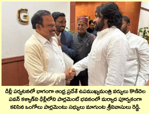
ఢిల్లీ పర్యటనలో భాగంగా ఆంధ్ర ప్రదేశ్ ఉపముఖ్యమంత్రి వరకలు కొడిగెల పవన్ కళ్యాణ్ ని ఢిల్లీలోని పార్లమెంట్ భవనంలో మర్యాద పూర్వకంగా కలిసిన ఒంగోలు పార్లమెంటు సభ్యులు మాగుంట శ్రీనివాసులు రెడ్డి.