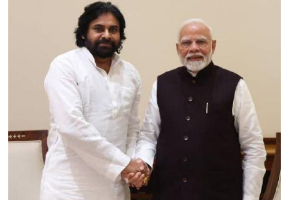
2021 నుంచి నిధులు అందలేదు

గత వైస్సార్సీ ప్రభుత్వం మ్యూజింగ్ గ్రాంట్ ఇవ్వబోవడం వల్ల ఈ పథకంలో 2 వేల కోట్ల రూపాయల్లో ఏపీ వాడుకుందని, ఇంకా 16 వేల కోట్లు వాడుకోవాలి ఉందన్నారు. ఆ నిధులు ఉపయోగించుకోవడానికి సహకరించాలని కోరారు. తర్వాత ఆర్థిక మంత్రి నిర్మలా సీతారామన్ తో భేటీ అయిన పవన్ ఏపీలో గ్రామీణ రహదారుల అభివృద్ధికి ఏపీలోని ఇన్ఫ్రాస్ట్రక్చర్ ఇన్వెస్ట్మెంట్ బ్యాంక్ నుంచి తీసుకునే రుణం వెలులటాట్లు కల్పించాలని కేంద్ర ఆర్థిక మంత్రి నిర్మలా సీతారామన్ కు విజ్ఞప్తి చేశారు. ఏబిఐఐ నుంచి తీసుకున్న రుణానికి ప్రాజెక్టు గడువును రహదారి ప్రాజెక్టు పూర్తి చేసేందుకు ఇచ్చిన గడువును 2026 డిసెంబర్ వరకు పొడిగించాలని కోరారు. ఇందుకోసం బిల్లులు రి యింట్రిమెంట్ పద్ధతిలో కాకుండా ముందుగానే చెల్లించాలని విజ్ఞప్తి చేశారు. ఏబిఐఐ గతంలో ఒప్పాకున్న ప్రకారం 3 వేల 834.52 కోట్ల రూపాయలు మంజూరు చేసేలా చూడాలని