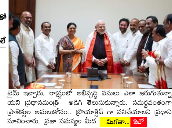
టైమ్ ఇచ్చారు. రాష్ట్రంలో అభివృద్ధి పనులు ఎలా జరుగుతున్నాయని ప్రధానమంత్రి అడిగి తెలుసుకున్నారు. సమర్థవంతంగా ప్రాజెక్టుల అమలుకోసం.. ప్రాయాత్నిక గా పనిచేయాలని ప్రధాని సూచించారు. ప్రజా సమస్యల మీద మిగతా.. 2లో