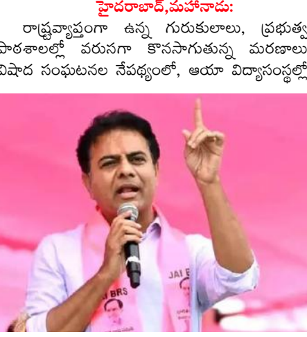
నెలకొన్న పరిస్థితులను తెలుసుకునేందుకు పార్టీ తరపున గురుకుల బాట పేరుతో ప్రత్యేక కార్యక్రమం చేపట్టనున్నట్లు బీఆర్ఎస్ పార్టీ వర్కర్స్ ప్రెసిడెంట్ కేటీఆర్ ప్రకటించారు. ఈనెల 30 తేదీ నుంచి వచ్చే నెల 7వ తేదీ వరకు ఈ కార్యక్రమం కొనసాగుతుందని కేటీఆర్ తెలిపారు. ఈ కార్యక్రమంలో భాగంగా రాష్ట్రంలో ఉన్న గురుకుల విద్యాసంస్థలతో పాటు కేజీబీవీ, మోడల్ స్కూళ్ల, ప్రభుత్వ రెసిడెన్షియల్ పాఠశాలలను పాలిటెస్టు పరిశీలిస్తారు. ఈ గురుకుల బాట కార్యక్రమానికి ఎంఎల్ఎ, ఎమ్మెల్యే, ఎంపి, మిగతా.. 2లో