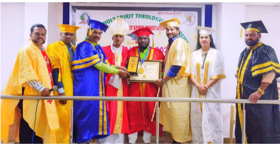
ఆయనకి డాక్టరేట్ పట్టా ప్రదానం చేశారు.

ఆయన చేస్తున్న సేవలను గుర్తించి డి ప్రెస్బింగ్ థియాలజికల్ యూనివర్సిటీ టెక్సాస్ యు.ఎన్.ఎంచంటి ముదిరాజ్ చేసిన సంఘం నేప, సామాజిక సేవకు గుర్తించిన డి ప్రెస్బింగ్ థియాలజికల్ యూనివర్సిటీ టెక్సాస్ యు.ఎన్.ఎ విజ్ఞాపించి గౌరవప్రదంగా