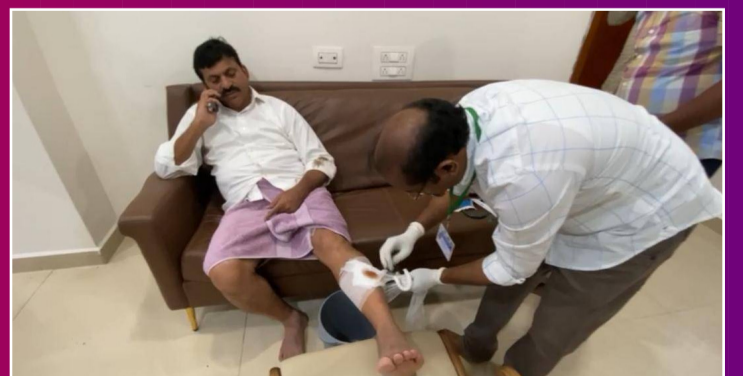
ఖమ్మం జిల్లా రూరల్ మండలంలో వరద ప్రభావిత ప్రాంతాల్లో మంత్రి పొంగులేటి శ్రీనివాస్రెడ్డి ప్రమాదవశాత్తు బైక్పై కింద పడి గాయాలు

డ్రోన్ల ద్వారా వరద బాధిత ప్రాంతాల్లో ప్రజలకు ఆహారం చేరవేసేందుకు తీసుకువచ్చిన డ్రోన్ల పని తీరును సీఎంకు వివరించిన అధికారులు