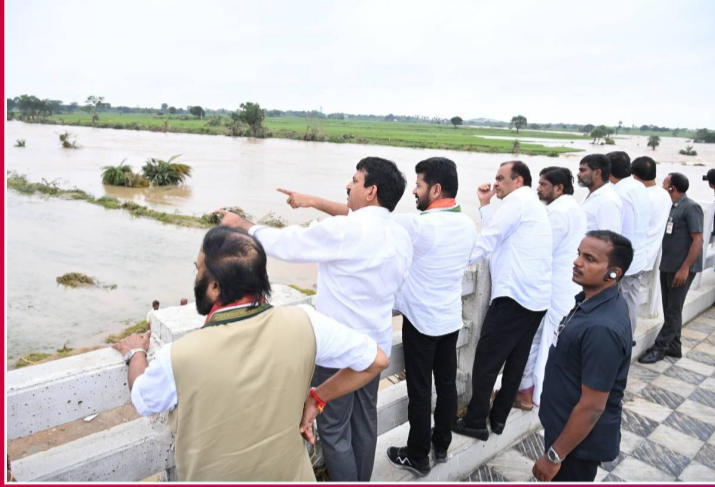
వరద ఉధృతికి దెబ్బతిన్న పాలేరు కెనాల్ను పరిశీలించిన సీఎం రేవంత్ రెడ్డి, డిప్యూటీ సీఎం భట్టి విక్రమార్య మంత్రులు పొంగులేటి శ్రీనివాస్ రెడ్డి, ఉత్తమ్ కుమార్ రెడ్డి