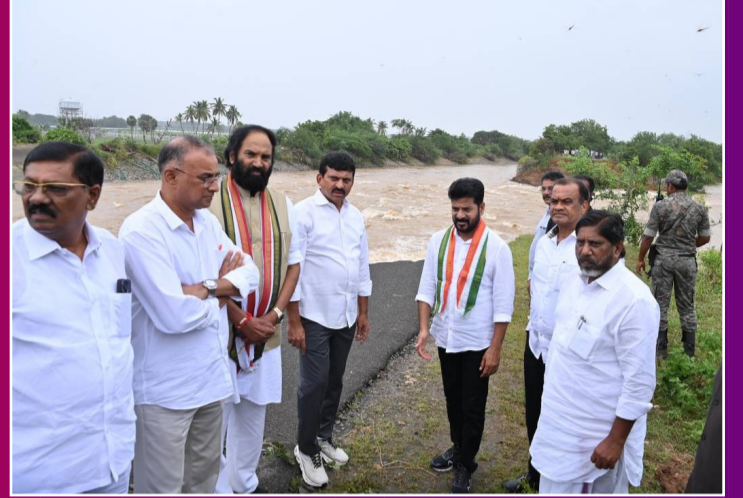
ఖమ్మం పట్టణంలో మున్నేరు వాగు పక్కన ఉన్న పోలేపల్లి రాజీవ్ గ్రహాకల్ప కాలనీని పరిశీలించిన ముఖ్యమంత్రి రేవంత్ రెడ్డి. ఉప ముఖ్యమంత్రి భట్టి విక్రమార్య