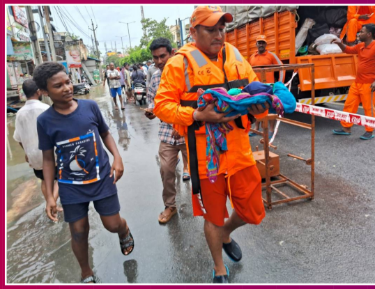
విజయవాడ 46వ వార్డును ముంచెత్తిన వరదల్లో చిక్కుకున్న... రోజుల పనికందుని, దివ్యాంగులను సురక్షిత ప్రాంతాలకు తరలిస్తున్న ఎస్టీఆర్ఎఫ్ సిబ్బంది..

డిజిటల్ న్యూస్ పేపర్ || మంగళవారం 03, సెప్టెంబర్ 2024