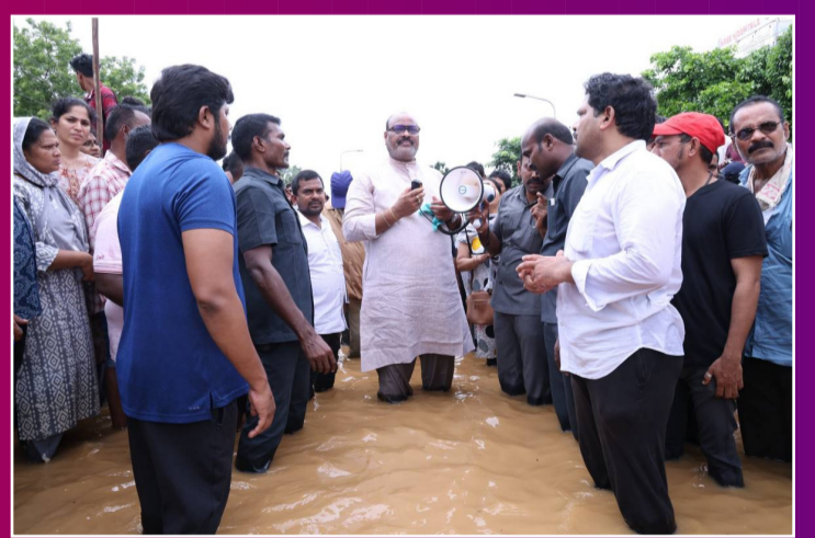
జయవాడ అజిత్ సింగ్ నగర్ వరద ముంపు ప్రాంతాల్లో పర్యటించిన మంత్రి అచ్చెన్నాయుడు