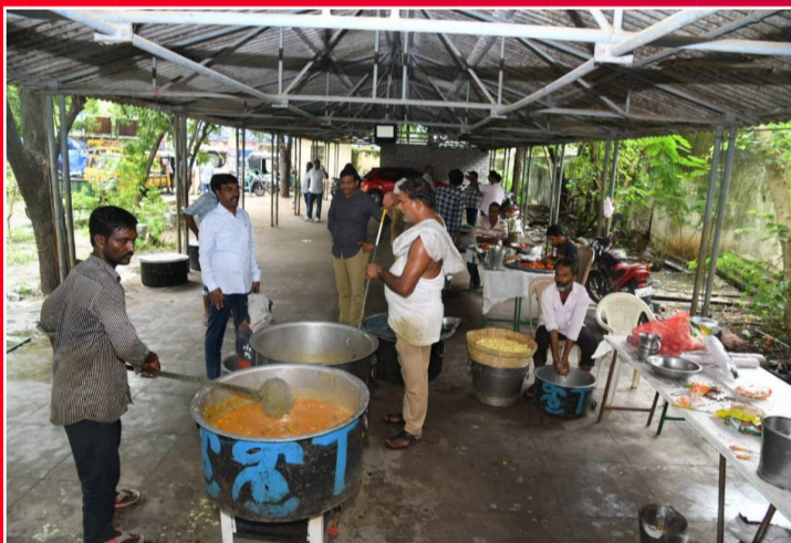
ఖమ్మం మున్నేరు వరద బాధితుల కోసం ఏర్పాటు చేసిన పునరావాస కేంద్రాల్లో రాజ్యసభ ఎంపీ వద్దిరాజు రవిచంద్ర ఆధ్వర్యంలో ఏర్పాటు చేసిన అన్నదాన కార్యక్రమం సన్నాహాలు..