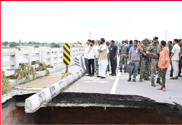
ఖమ్మం నాయకనిగూడెం దగ్గర దెబ్బ తిన్న రోడ్డు, పాలేరు ఏరును పరిశీలించిన సీఎం రేవంత్ రెడ్డి, డిప్యూటీ సీఎం భట్టి విక్రమార్య మంత్రి పొంగులేటి.