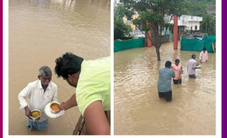
మంత్రి నారా లోకేష్ సహకారంతో నీరుకొండ వరద బాధితులకు భోజనం వ్యాకెట్లు పంపిణీ 200 మంది బాధితులకు భోజనం పంపిణీ చేయించిన మంత్రి నారా లోకేష్