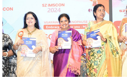
వస్తావున్నారు. అటువంటి సమయంలో వైద్యుల సలహాలు సూచనలు తీసుకోవడం ద్వారా మొసాపాజీ దశను అధిగమించే దుకు ఉపయోగపడతాయన్నారు.

ఈ సందర్భంగా వారు మాట్లాడుతూ నెలసరి ఆగిపోయే సమయంలో మహిళలు ఆరోగ్య పరంగా అనేక సమస్యలు ఎదుర్కోవాల్సి వస్తుందన్నారు. శరీరంలో హార్మోన్స్ తగ్గడం వలన ఒత్తిడి లోనవుతారని, గుండెకు సంబంధించిన సమస్యలు కూడా