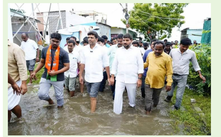
భారీ వర్షాల కారణంగా గుంటూరు తూర్పులో ముంపునకు గురైన ప్రాంతాలను పరిశీలించిన కేంద్రమంత్రి పెమ్మసాని చంద్రశేఖర్, గుంటూరు తూర్పు శాసనసభ్యులు మొహమ్మద్ నసీర్