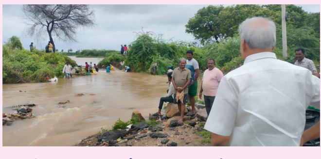
నిన్నటి నుంచి కురుస్తున్న భారీ వర్షాల వల్ల జగ్గయ్యపేట మండలం చిల్లకల్లు చెరువుకి గండిపడటం వల్ల వర్షపు నీరు ఊళ్లోకి రావడం వల్ల ప్రజలు ఇబ్బందులకు గురవుతున్నారని తెలుసుకొని చెరువు ప్రాంతాన్ని పరిశీలించిన ఎస్సీఆర్ జిల్లా తెలుగుదేశం పార్టీ అధ్యక్షుడు మాజీ మంత్రి నెట్టం శ్రీ రఘురామ్