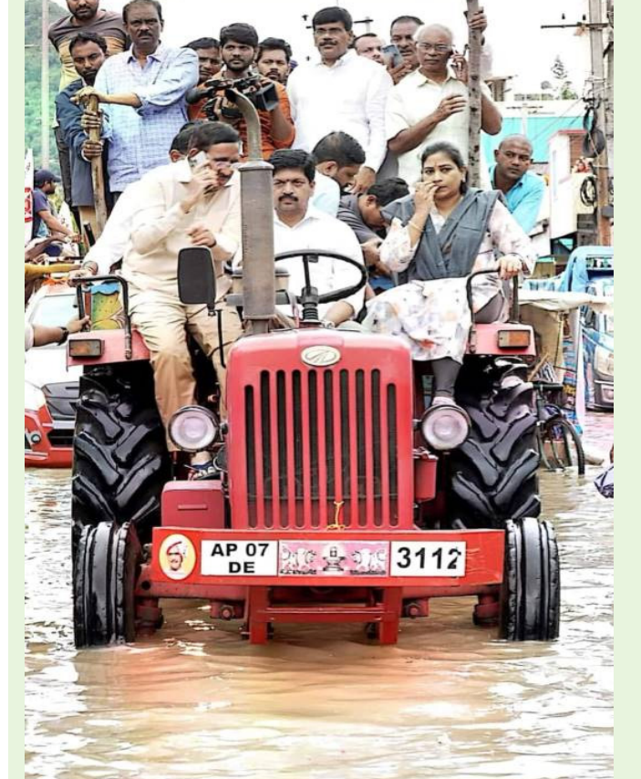
జగన్ జరదేఖో, మంత్రిలంటే ఇలా వుండాలి.... ప్రజలకు కష్టం వచ్చినపుడు మంత్రులు ఎమ్మెల్యేలు ఎంటేలు..ముందు ఉండాలి...