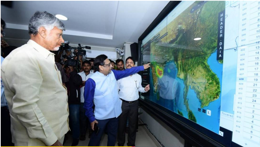
నష్టపోయిన ప్రతి ఒక్కరికీ