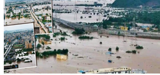
బుడమేర గత 5 ఏళ్ళుగా అక్రమణలకు గురయ్యింది. ఇష్టం వచ్చినట్లు కాలువ కట్టా చేసి, వైసీపీ నేతలు అమ్ముకున్నారు. బుడమేర కుంచించుకుని పోయింది. ఫలితంగానే, ఈ రోజు విజయవాడకు ఈ స్థాయి వరద.

ఇక రెండోది బుడమేర.. నగరం వెంట పారుదలయ్యే