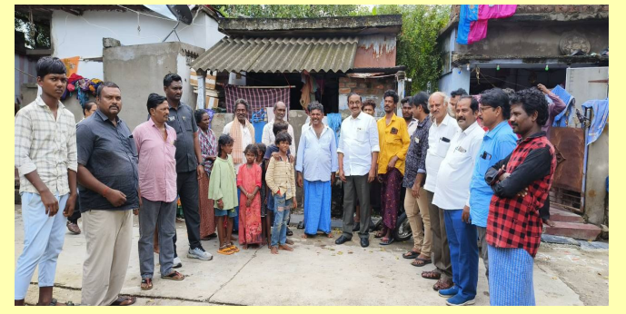
ధ్యానికే అధిక ప్రాధాన్యం ఇవ్వాలని అన్నారు. గ్రామాల్లో చెత్త పేరుకుపోకుండా చూసుకోవాలని సూచించారు. గ్రామాల్లో అభివృద్ధికి నిలువెత్తు చిహ్నాలనే వాటి పరిరక్షణ బాధ్యతను ప్రతి పౌరుడు తీసుకోవాలని ఎమ్మెల్యే డా.చదలవాడ అరవింద బాబు సూచించారు.

సమన్వయ కాలనీలను సృష్టించుకుందామని నరసరావుపేట ఎమ్మెల్యే డా.చదలవాడ అరవింద బాబు అన్నారు. కేసానుపల్లి పంచాయతీ పరిధిలోని ఎస్సీ కాలనీలో పర్యటించారు. వర్షాలు తీవ్రంగా కురుస్తున్న నేపథ్యంలో పారిశు