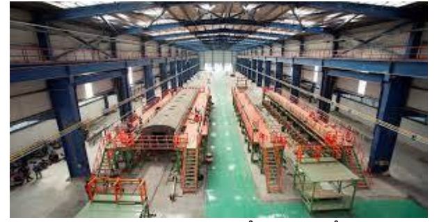
ఈ నెల 9న దక్షిణ మధ్య రైల్వే అధ్యక్షులలో నిర్వహించిన రైల్వేభద్రతా కమిటీ సమావేశంలో.. పాకాల రైల్వేస్టేషన్కు సంబంధించిన పనులకు ఆమోదం లభించిందని తెలిపారు. ఈ మేరకు గుంతకల్ డివిజన్ కార్యాలయానికి ఉత్తర్వులు వచ్చాయని.. త్వరలో పనులు ప్రారంభం అవుతాయన్నారు.