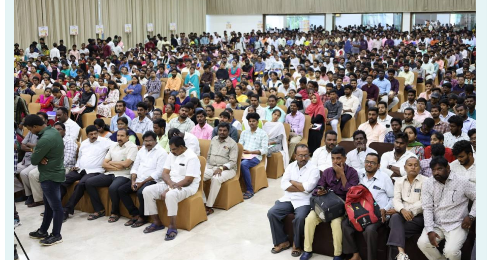
ఆసించిన దానికన్నా ఎక్కువ మంది జాబ్ మేళా రావడం నిరుద్యోగ సమస్య త్రివితకు అడ్డం పడుతుందన్నారు. జాబ్ మేళాలో ఉద్యోగ అవకాశం కోసం వచ్చిన వారిని అవసరం లేదని వివిధ ఫౌండేషన్ అధ్యక్షులలో జాబ్ మేళా ప్రక్రియ