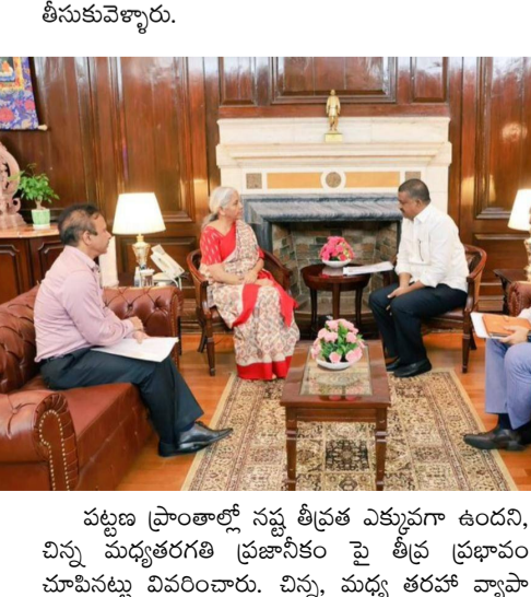
పట్టణ ప్రాంతాల్లో నష్ట తీవ్రత ఎక్కువగా ఉందని, చిన్న మధ్యతరగతి ప్రజాసీకం పై తీవ్ర ప్రభావం చూపినట్లు వివరించారు. చిన్న, మధ్య తరహా వ్యాపా

● కేంద్ర మంత్రితో ఏపీ ఆర్థిక మంత్రి, అధికారులు భేటీ హుద్దేబ్బి, కేంద్ర ఆర్థిక మంత్రి నిర్మలా సీతారామన్ తో మంగళవారం సుమారు 20 నిమిషాలు ఏపీ ఆర్థిక మంత్రి పయ్యప్పల కేశవ్, రాష్ట్ర అధికారులు భేటీ అయ్యారు. విజయవాడ సహా... రాష్ట్రంలో పలు ప్రాంతాల్లో పరదల వల్ల సంభవించిన నష్టంపై కేంద్ర మంత్రికి వివరాలు అందించారు. సీఎం చంద్రబాబు ఆదేశాల మేరకు రాష్ట్ర ప్రభుత్వ ప్రాథమిక నివేదిక కాపీని నిర్మలా సీతారామన్ అందజేశారు. కేంద్ర మంత్రితో భేటీకి ముందు... కేశవ్, రాష్ట్ర అధికారులతో జూమ్ కాన్ఫరెన్స్ లో చంద్రబాబు మాట్లాడి, సూచనలు ఇచ్చారు. నిర్మలా సీతారామన్ దృష్టికి తీసుకెళ్ళాల్సిన అంశాలపై మార్గనిర్దేశం చేశారు. ప్రస్తుతం సంభవించిన పరదలు ఎక్కువగా పట్టణ ప్రాంతాల్లో ప్రభావం చూపినట్లు కేంద్రం దృష్టికి కేశవ్