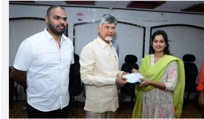
ఎమ్మెల్యే బండారు శ్రావణి శ్రీ రూ.1.5 లక్షలు, ఒక నెల వేతనం