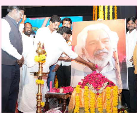
రవీంద్రభారతిలో గద్దర్ ఫౌండేషన్ ఆధ్వర్యంలో జరిగిన గద్దర్ ప్రథమ పద్యం సభకు హాజరైన డి.పూజీ సీఎం భట్టి విక్రమార్కు గద్దర్ చిత్రపటం పద్మ పూలమాలలు వేసి నివాళులర్పించిన డి.పూజీ సీఎం

పర్యటనలో ఉన్న ముఖ్యమంత్రి న్యూయార్క్ నగరంలో భారత అంధుల క్రికెట్ జట్టు క్రీడాకారులను కలుసుకున్నారు. వారిని కలుసుకున్న సందర్భం తనకు లభించిన ఒక అమూల్యమైన అవకాశంగా భావిస్తున్నారని ముఖ్యమంత్రి అన్నారు. వారితో ఆస్వాదనంగా కొద్దిసేపు ముచ్చటించారు. జీవితంలో ఎలాంటి సవాళ్లున్నా ఎదుర్కొనే మానసిక స్థైర్యాన్ని వారి నుంచి నేర్చుకోగలమన్నారు. వారిలోని స్ఫూర్తిని అభినందిస్తూ వారికి ముఖ్యమంత్రి శుభాకాంక్షలు తెలియజేశారు.