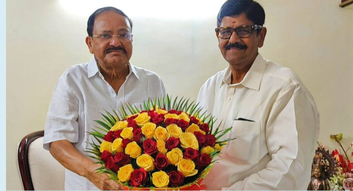
మాజీ ఉపరాష్ట్రపతి వెంకయ్య నాయుడును మర్యాదపూర్వకంగా కలిసిన దేవదాయ శాఖ మంత్రి ఆనం రామనారాయణ రెడ్డి

ఎంపీ మిథున్ రెడ్డికి సీల్మాప్ భద్రత... మిథున్ రెడ్డికి ప్రత్యర్థుల నుంచి హాని ఉందనే కేంద్ర ఇంటలిజెన్స్ నివేదికతో భద్రత పెంపు... ఇక సురక్షితంగా మిథున్ రెడ్డికి సీల్మాప్ బలగాలతో భద్రత