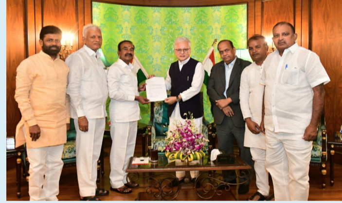
ఈనెల 18 న ఉప్పల్ శిల్పారామంలో నిర్వహిస్తున్న రక్షాబంధన్ కార్యక్రమానికి రాష్ట్ర గవర్నర్ జిట్ట దేవ్ వర్మని ఆహ్వానించిన మల్కాజ్గిరి పార్లమెంటు సభ్యులు ఈటల రాజేందర్.