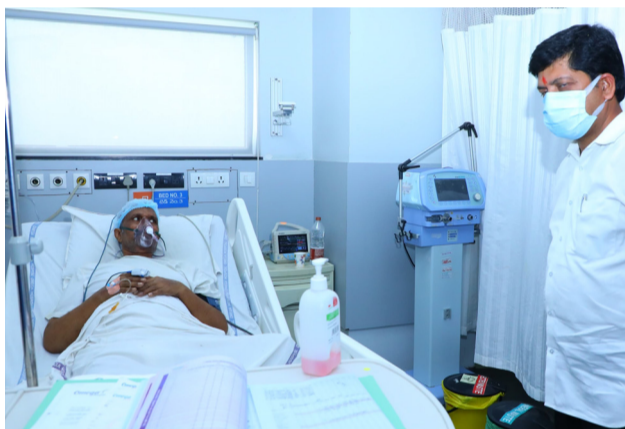
చూపించే ప్రేమాభిమానాలకు కొలమానంగా ఈ ఘటన నిలిచింది.