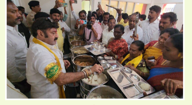
హిందూపురంలో అన్న క్యాంటీన్లను ప్రారంభించిన ఎమ్మెల్యే నందమూరి బాలకృష్ణ