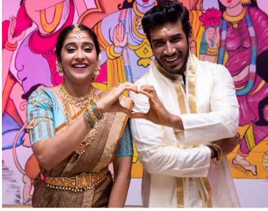
కురువిల్లా, ప్రియదర్శి, ఆమని, సుధ కీలక పాత్రలు పోషిస్తున్నారు.