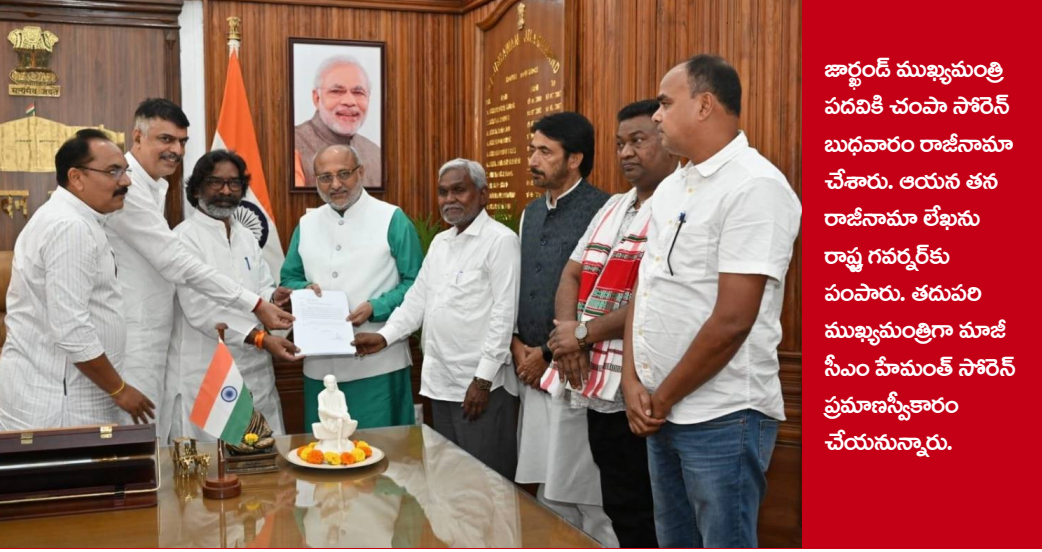
జార్జండ్ ముఖ్యమంత్రి పదవికి చంపా సోరెన్ బుధవారం రాజీనామా చేశారు. ఆయన తన రాజీనామా లేఖను రాష్ట్ర గవర్నర్ కు పంపారు. తదుపరి ముఖ్యమంత్రిగా మాజీ సీఎం హిమంత్ సోరెన్ ప్రమాణస్వీకారం చేయనున్నారు.

ఆమె అమెరికా వెళ్లిన విషయం తెలుసుకున్న సిబిడి లుక్ అవుట్ నోటీసు జారీ చేసింది. దీంతో బుధవారం రాత్రి ఆమె అమెరికా నుంచి వచ్చిన వెంటనే ఇమ్మిగ్రేషన్ అధికారులు హైదరాబాద్ విమానాశ్రయంలో అదుపులోకి తీసుకున్నారు. గురువారం ఆమెను ఇమ్మిగ్రేషన్ అధికారులు ఏ పీ సి ఐ డీ అధికారులకు అప్పగిస్తారని సమాచారం