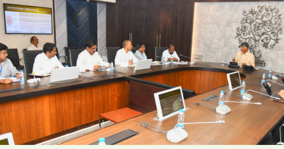
సచివాలయంలో బుధవారం జరిగిన సమీక్షలో సీజనల్ వ్యాధుల నివారణకు తీసుకున్న చర్యలపై అధికారులు సీఎంకు వివరించారు. మలేరియా, డెంగ్యూ నివారణకు కార్యాచరణ అమలు చేస్తున్నామని, ఫీవర్ కేసులు ఎప్పటికప్పుడు మానిటర్ చేస్తున్నామని, హైరిస్కీ కేసులపై ప్రత్యేక ఫోకస్ పెట్టామని అధికారులు వివరించారు. డెంగ్యూ, చికెన్ గున్యాకు ర్యాపిడ్ టెస్ట్ ప్రభుత్వ ఆసుపత్రుల్లో అందుబాటులో ఉందని అన్నారు.

తీసుకోవాలని, ఇప్పుడు చర్యలకు దిగితే పూర్తి ఫలితాలు రావని సీఎం అన్నారు. ఆయా శాఖల్లో 2014 నుంచి 2019 వరకు నాటి డి.డిపీ పాలనలో అనుసరించిన ఉత్తమ విధానాలు (బెస్ట్ ప్రాక్టీస్) అన్నీ మళ్లీ అమలు చేయాలని అధికారులను ఆదేశించారు.