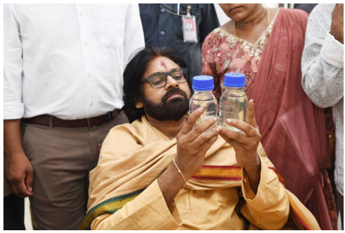
ప్రతి ఒక్కరినీ పలకరిస్తూ...