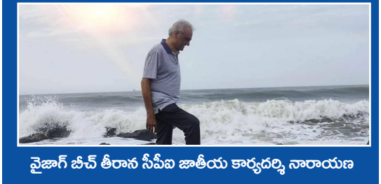
వైజాగ్ బీచ్ తీరాన సీపీఐ జాతీయ కార్యదర్శి నారాయణ