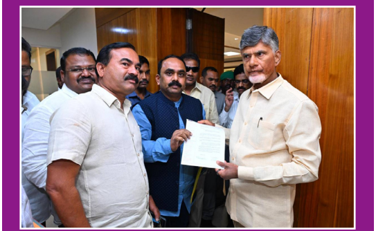
రాష్ట్ర విభజనానంతరం అవలంబితంగా ఉన్న ఉద్యోగుల సమస్యలపై ముఖ్యమంత్రికి విజ్ఞాపన పత్రం సమర్పించిన ఏ.పీ.గిజిబద్ది అధికారుల సంఘం. ఈ నెల 6 తేదీన జరగబోవు రెండు రాష్ట్రాల ముఖ్యమంత్రుల డైవోక్షిక సమావేశంలో వాటిని చర్చించాలని వినరి.