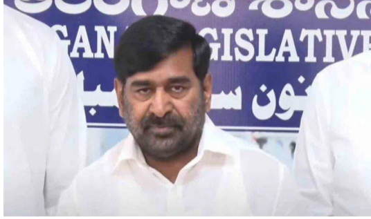
కాంగ్రెస్ ప్రభుత్వం సాకులు చెబుతున్నదని విమర్శించారు.

అసెంబ్లీ మీడియా పాయింట్ వద్ద ఆయన మాట్లాడారు. నీళ్లు ఎలా లిఫ్ట్ చేయాలో తెలిసే కేసీఆర్ కన్నెపల్లి వద్ద పంప్ హౌస్ నిర్మించారన్నారు. మేడిగడ్డకు ఏదో జరిగిందని ప్రభుత్వం చెబుతున్నది. ఇప్పుడు మేడిగడ్డ వద్ద 10 లక్షల క్యూసెక్కుల నీళ్లు వృధాగా పోతున్నాయని చెప్పారు. మల్లన్న సాగర్, కొండపోచమ్మ సాగర్, సింగూరు ప్రాజెక్టులు నీళ్లు లేక ఎండిపోతున్నాయని చెప్పారు. కోదాడ, సూర్యపేట నియోజకవర్గాల్లో రైతులు నీళ్ల కోసం ఎదురుచూస్తున్నారని వెల్లడించారు. ఎన్డీఎస్ పేరుతో