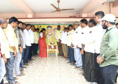
రంగాలకు సరికొత్త మార్గనిర్దేశం చేసిన దార్శనికులు కలాం అని కొనియాడారు.

సందిగామ, మహానాడు: మిస్సెల్ మ్యూజ్ ఆఫ్ ఇండియాగా భారత మాజీ రాష్ట్రపతి, ప్రఖ్యాత శాస్త్రవేత్త డాక్టర్ ఏపీజే అబ్దుల్ కలాం గుర్తింపు పొందారని ఎమ్మెల్యే తంగిరాల సౌమ్య కొనియాడారు. సందిగామ పట్టణం కాకాని నగర్ కార్యాలయంలో భారత మాజీ రాష్ట్రపతి ఏపీజే అబ్దుల్ కలాం వర్తతి చేపడుతున్న నిర్వహించారు. స్థానిక ఎన్టీసీ సేతలతో కలిసి ఆయన చిత్రపటానికి పూలమాలవేసి నివాళులర్పించారు. ఈ సందర్భంగా ఎమ్మెల్యే మాట్లాడుతూ.. భారత మాజీ రాష్ట్రపతి అబ్దుల్ కలాం శాస్త్ర సాంకేతిక రంగాల్లో మన దేశాన్ని ఎంతో ముందుకు నడిపించారు. సంకల్పం ఉంటే ఎంతటి ఉన్నత శిఖరాలైనా చేరగలమన్న సందేశాన్ని యువతరానికి అందించారన్నారు. దేశ అభి, శాస్త్రీయ