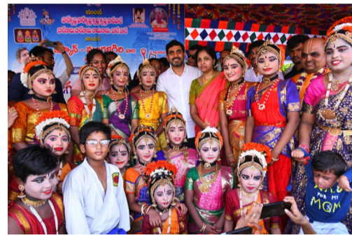
విద్య, బడి, ఎలక్ట్రానిక్స్ శాఖల మంత్రి నారా లోకేశ్ ముఖ్యఅతిథిగా హాజరయ్యారు. శ్రీ జగన్నాథుడు, బలరాముడు, సుభద్రల విగ్రహాలకు

ప్రముఖ పుణ్యక్షేత్రమైన మంగళగిరిలో ఇస్కాన్ ఆధ్వర్యంలో జగన్నాథుని రథయాత్ర వైభవంగా సాగింది. మంగళగిరి బస్టాండు వద్ద నుంచి ప్రారంభమైన ఈ కార్యక్రమానికి రాష్ట్ర