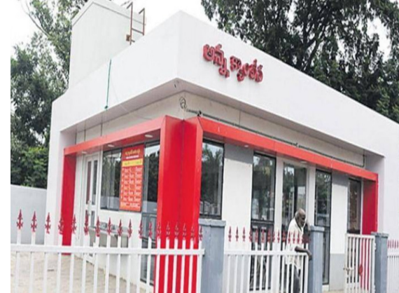
పశు కొత్త భవనాల నిర్మాణం, పాత పెండ్లింగ్ బిల్లుల చెల్లింపుల కోసం మరో రూ.65 కోట్లను కూడా విడుదల చేశారు.

అమరావతి, మహానాడు: ఆగస్టు 15న అన్న క్యాంప్ ను తిరిగి ప్రారంభించాలని ప్రభుత్వం భావిస్తోంది. స్వాతంత్ర్య దినోత్సవం కాబట్టి.. ఆరోజు క్యాంప్ ను పేదలకు అందుబాటులోకి తీసుకొచ్చే విషయాన్ని పరిశీలిస్తోంది. అయితే అధికారికంగా ప్రకటన మాత్రం రావాల్సి ఉంది. తొలి దశలో 183 క్యాంప్ ను ప్రారంభించాలని టార్గెట్ గా పెట్టుకుంది.. ఈ మేరకు ఏర్పాటు చేపట్టారు. గత టీడీపీ ప్రభుత్వ హయాంలో నిర్వహించిన క్యాంప్ ఖరీదులను అన్ని సౌకర్యాలతో సిద్ధం చేసే పనిలో ఉన్నారు అధికారులు. దీనికి సంబంధించిన టెండర్లు పిలిచి పనులను వేగంగా పూర్తి చేయాలని ప్రభుత్వం ఆదేశించింది. గతంలో ప్రారంభించిన 183 క్యాంప్ ను రూ.20 కోట్లతో మరమ్మత్తులు చేస్తున్నారు. అలాగే క్యాంప్ లలో ఐవోటీ డిజైన్లను ఏర్పాటు చేయడంతో పాటుగా సాఫ్ట్ వేర్ అప్డేట్స్ కోసం రూ.7 కోట్లను ప్రభుత్వం కేటాయించింది. రాష్ట్రవ్యాప్తంగా 20 క్యాంప్