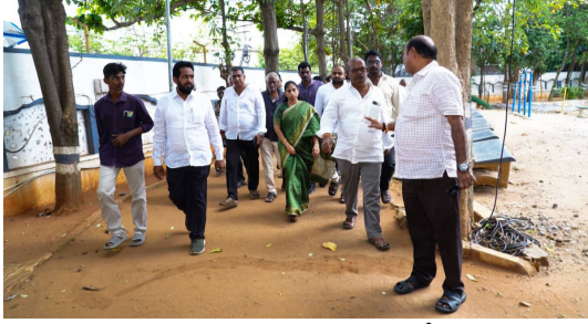
మాట్లాడి సమస్యను పరిష్కరిస్తానని ఎమ్మెల్యే గళ్యా మాధవి హామీనిచ్చారు.

గుంటూరు నగర వాసులకు ఆహ్లాదాన్ని పంచే పార్కులను పరిశుభ్రంగా ఉంచి అవసరమైన మౌలిక సదుపాయాలను కల్పించేందుకు చర్యలు తీసుకోవాలని గుంటూరు పశ్చిమ నియోజకవర్గ ఎమ్మెల్యే మాధవి అధికారులను ఆదేశించారు. పార్కును పరిశీలించి పార్కు పరిసరాల పరిశుభ్రంగా ఉండేలా చర్యలు తీసుకోవాలని అధికారులను ఆదేశించారు. పార్కులో సమస్యలను ఎమ్మెల్యే గళ్యా మాధవి దృష్టికి తీసుకొనివచ్చారు. ప్రధానంగా పార్కులో విద్యుత్ ట్రాన్స్ ఫార్మర్ ఉండటం వలన అది ప్రమాదకరంగా ఉందని, దాన్ని పార్కు బయట ఏర్పాటు చేయాలని ఎమ్మెల్యే గళ్యా మాధవి కోరారు. ఈ విషయంపై గళ్యా మాధవి స్పందిస్తూ... విద్యుత్ శాఖ అధికారులతో