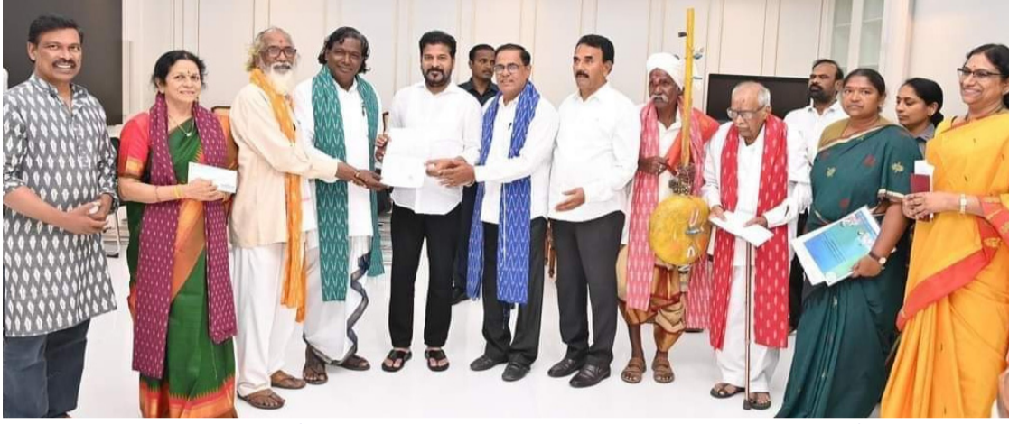
సచివాలయంలో పద్మశ్రీ అవార్డు గ్రహీతలకు ఒక్కొక్కరికి రూ.25లక్షల చెక్కును అందించిన ముఖ్యమంత్రి సీఎం రేవంత్ రెడ్డి