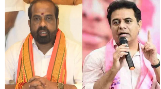
ఓదార్చుకోండి" అని మంత్రి సత్యకుమార్ యాదవ్ మాజీ మంత్రి కేటీఆర్ కు ఎక్స్ అకౌంటు ఇచ్చారు.

అమరావతి, మహానాడు: ఏపీ మంత్రి సత్యకుమార్ - బీఆర్ఎస్ వర్సింగ్ ప్రెసిడెంట్ కేటీఆర్ మధ్య ఎక్స్ వేదికగా కౌంటర్-ఎన్ కౌంటర్ నడిచింది. చివరకు సత్య సంధించిన వ్యంగ్యాస్త్రాలు భరించలేక కేటీఆర్, తన ఎక్స్ అకౌంటులో సత్యను బ్లాక్ చేయడం ఆసక్తి కరంగా మారింది. 'నిరంతరం ప్రజల మధ్య ఉండే కేతిరెడ్డి లాంటి వాడు కూడా ఓడిపోవడం ఆశ్చర్యపరిచిందన్న కేటీఆర్ వ్యాఖ్యలపై సత్య వ్యంగ్యాస్త్రాలు సంధించారు. దానితో ఆగ్రహించిన కేటీఆర్ తన ఎక్స్ అకౌంటులో సత్యను బ్లాక్ చేశారు.