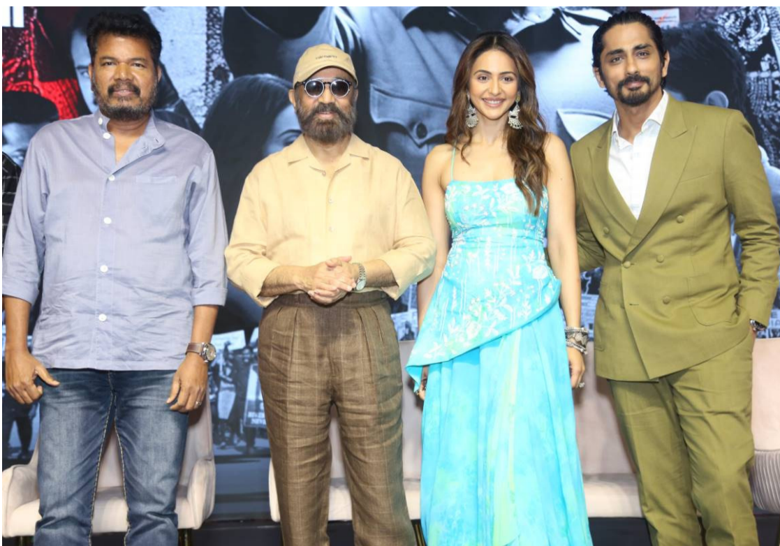
అన్ని వర్గాల వారిని ఆకట్టుకునే