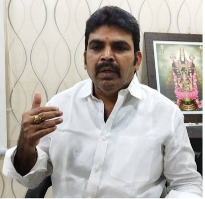
ఇసుకతో దాదాపు 10 లక్షల పైగా ఇల్లు కట్టుకునే వారని, వారి అవినీతి ఏ స్థాయిలో అవినీతి చేశారు అర్థం చేసుకోవచ్చన్నారు. పౌరదర్యుకత ముందు చూపుతో ముఖ్యమంత్రి చంద్రబాబు శాండ్స్ పాలన రూపొందించారన్నారు. ఉచిత ఇసుక విధానం వల్ల ఎన్నో లక్షల కుటుంబాలకు ఉపాధి లభిస్తుందన్నారు. ప్రజలకు ఇచ్చిన హామీలు నెరవేర్చే రాష్ట్రాన్ని అభివృద్ధిలో నడపడమే కూటమి లక్ష్యమన్నారు.