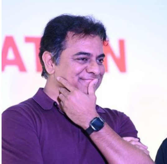
ముఖ్య ఉద్యమం నాటి పరిస్థితులను ఎందుకు కల్పిస్తున్నారు. నిత్యం పోలీసుల బాట్ల చప్పుళ్లతో ఎందుకు కలవరపడే తున్నారు. డీఎస్సీ అభ్యర్థులకు బీఆర్ఎస్ పార్టీ అందంగా ఉంటుందని కేటీఆర్ భరోసా ఇచ్చారు.

డీఎస్సీ అభ్యర్థులపై పోలీసులను ప్రయోగించి అణచివేస్తున్నారు. వందల మందిని అన్యాయంగా అరెస్ట్ చేసి అక్రమ కేసులు పెడుతున్నారు. కనీసం శాంతియుతంగా నిరసన తెలిపే హక్కును కూడా కాలరాస్తున్నారు. గుర్తుపెట్టుకోండి.. ఉస్మానియా విశ్వవిద్యాలయం దేశ సరిహద్దుల్లో లేదు. మరెందుకు ఇన్ని బలగాలు, ఎందుకు ఇంతటి నిర్బంధం.