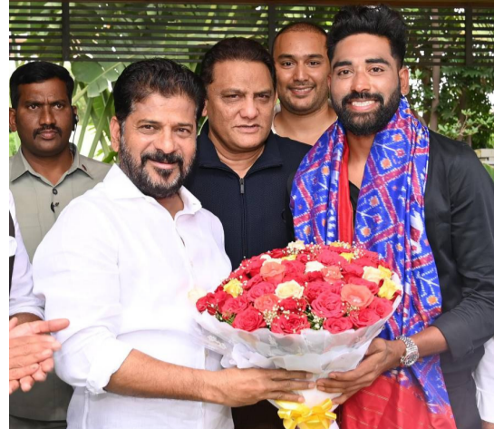
దుకు వెంటనే చర్యలు తీసుకోవాలనిదిగా ముఖ్యమంత్రి అధికారులను ఆదేశించారు.

సిరాజ్ కు రాష్ట్ర ప్రభుత్వం తరఫున ఉద్యోగం, ఇంటి స్థలం కేటాయింపులను అధికారులను ఆదేశించారు. హైదరాబాద్ లో లేదా చుట్టుపక్కల ప్రాంతాల్లో అందుకు అనువైన స్థలాన్ని వెంటనే గుర్తించాలని, అలాగే ప్రభుత్వ ఉద్యోగం కల్పించే