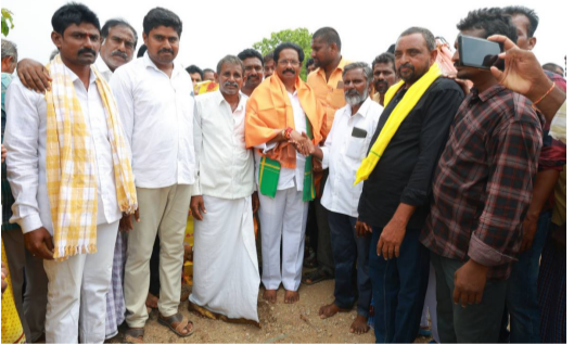
మార్కాపురం రోడ్డు క్రమర టౌన్షిప్ వద్ద ఇసుక దంపింగ్ యార్డులో ఇసుక పంపిణీని మంగళవారం ఎమ్మెల్యే జీవి ప్రారంభించారు. నియోజకవర్గంలో ఇంటి నిర్మాణాలు