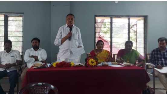
వచ్చే అవకాశం ఉందని, అధికారులు, సర్పంచులు అందుకు అనుగుణంగా నివేదికలు సిద్ధం చేసుకోవాలని సూచించారు. అధికారులు, ప్రజా ప్రతినిధులు సమీక్షితత్వం సమన్వయంతో పని చేసి ప్రస్తుతం అందుబాటులో ఉన్న నిధులతో డ్రైనేజీల సమస్య, త్రాగునీటి సమస్యలు పరిష్కారం చేసుకోవాలని కోరారు.

త్వరలో అవనిగడ్డ నియోజకవర్గానికి పవన్ కళ్యాణ్ సమీక్షకు