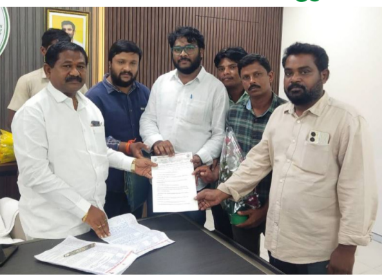
మంత్రిని కోరారు. ఈ విషయాలపై మంత్రి సానుకూలంగా స్పందించారు.

చాలా ఏళ్ల నుంచి వనతి గృహాల్లో ఔట్ సోర్సింగ్ విధానంలో పని చేస్తున్నామని తమను ఆస్టోనీలో చేర్వాలని మంత్రికి విన్నవించారు. ఈ విషయంపై మంత్రి వెంటనే సోషల్ వెల్ఫేర్ డివిజన్ వెల్ఫేర్ ఫోన్ లో మాట్లాడారు. పలువురు టీసీ సంఘం ప్రతినిధులు పేద బడుగు బలహీన వర్గాల విద్యార్థులకు ఏపీ స్టడీసర్కిల్ సెంటర్లలో ఉచితంగా డీఎస్సీ శిక్షణ ఇప్పించాలని మంత్రిని కోరారు. ఏపీ హాస్పింగ్ కార్పొరేషన్ లో పనిచేస్తున్న పలువురు ఔట్ సోర్సింగ్ ఉద్యోగులు తమను రెగ్యులర్ చేయాలని