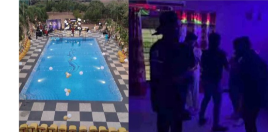
కాలేజీ విద్యార్థులకు డ్రగ్స్, ఈ-సిగరెట్స్, గంజాయి వంటివి సరఫరా చేస్తున్న వారిని గుర్తించేందుకు టీ న్యూట్ సైతం ప్రత్యేక చర్యలు చేపట్టింది.

రాష్ట్రంలో గంజాయి, డ్రగ్స్ వంటి మత్తుపదార్థాల నిర్మూలన, రేవ్ పార్టీలు, వ్యభిచారంపై పోలీసులు ఉక్కుపాదం మోపు తున్నారు. ఎన్ని చర్యలు చేపట్టినా తప్పుడు పనులు చేసే వారు మాత్రం ఆగడం లేదు. ఇప్పటికే ముఖ్యమంత్రి రేవంత్ రెడ్డి సైతం రాష్ట్రంలో డ్రగ్స్ నిర్మూలనపై ప్రత్యేక దృష్టి పెట్టారు. పాఠశాలలు,