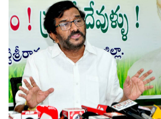
పత్రికను ప్రజలెవరూ చదవకపోవడంతో వలంటీర్ల పేరుతో ప్రభుత్వ ఖజానా నుంచి డబ్బు కట్టి సర్కులేషన్ పెంచుకునే ప్రయత్నం చేశారు. రామోజీరావుతో పాటు శైలజా కిరణ్ ను అక్రమంగా జైలుకు పంపాలని ఐదేళ్లూ జగన్మోహన్ రెడ్డి చేయని ప్రయత్నాలు లేవు.

అక్రమ కేసులు బనాయించి జైలుకు పంపినా లెక్కలేదు కుండా ప్రజల కోసం పోరాడారు. వైసీపీ ఐదేళ్ల పాలనలో రాష్ట్రాన్ని సర్వనాశనం చేశారు. టీడీపీ అధికారంలోకి వచ్చిన రోజు నుంచే సాక్షిలో పిచ్చి కూతలు రాస్తున్నారు. ఆ సాక్షి