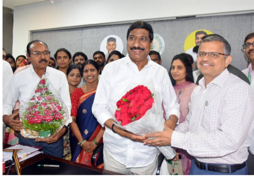
మంత్రి జనార్దన్ రెడ్డి పేర్కొన్నారు. రాష్ట్రంలో న్యూడెవలప్ మెంట్ బ్యాంక్ ఆర్థిక సహాయంతో రూ.6400 కోట్లతో 2 ప్రాజెక్టులు మంజూరు కాగా దానిలో 70% న్యూ డెవలప్ మెంట్ బ్యాంక్ రుణము మరియు 30%

దెబ్బతిన్న రహదారులను మరమ్మత్తులు చేపట్టి రోడ్లలో గుంతలు లేకుండా చేయాలని ప్రభుత్వం నిర్ణయించిందని చెప్పారు. జిల్లా అధికారులు నుండి గుంతలను పూర్తిగా తీసివేసి మరమ్మత్తులకు ముందు అత్యవసర మరమ్మత్తులకు రూ. 284 కోట్లతో ప్రతిపాదనలు వచ్చాయని మంజూరుకు పరిశీలన చేస్తున్నట్లు