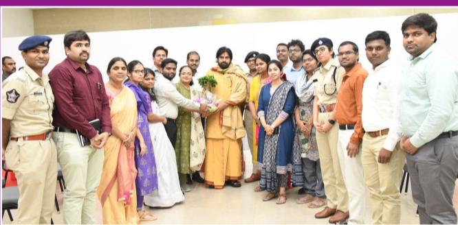
ఆంధ్ర ప్రదేశ్ రాష్ట్ర ఉప ముఖ్యమంత్రి పవన్ కళ్యాణ్ తో ఏపీపీఎస్సీ ద్వారా ఎంపికైన గ్రూప్ 1 అభ్యర్థులకు భేటీ అయ్యారు. తమ సమస్యలను వివరించారు.