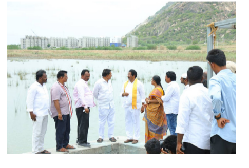
అన్నారు. ఫిల్టర్ బెడ్లు శుభ్రంగా లేకపోవడం, లీకేజీ ఉండటం వలన కలుషిత నీరు సరఫరా జరుగుతున్నట్లు గుర్తించడం జరిగిందన్నారు. యుద్ధ ప్రాతిపది చేసే ఫిల్టర్ బెడ్లు శుభ్రం చేసి, లీకేజీ మరమ్మత్తులు చేపట్టి శుద్ధమైన త్రాగునీటిని ప్రజలకు సరఫరా చేయాలని అధికారులను ఆదేశించడం జరిగిందన్నారు. మరమ్మత్తులకు ఒక రోజు నీటి సరఫరా నిలిపి వేసి పనులు పూర్తి చేస్తామని మున్సిపల్ అధికారులు చెప్పడం జరిగిందని ప్రజలు గమనించవలసిందిగా

పల్నాడు జిల్లాలోని త్రాగునీటి చెరువులను సాగర్ జనాలతో నింపేందుకు ప్రభుత్వం చర్యలు తీసుకుంటుందని ఎమ్మెల్యే జీపి ఆంజనేయులు తెలిపారు. వీని కొండ పట్టణానికి త్రాగునీరు సరఫరా చేసే సింగర చెరువును బుధవారం ఎమ్మెల్యే మున్సిపల్ అధికారులతో కలిసి పరిశీలించారు. ఈ సందర్భంగా ఆయన మాట్లాడుతూ చెరువులో నీటిమట్టం తగ్గుతుందని, చెరువులో ఉన్న నీరు నెల రోజులు పస్తాయని, సాగర్ కుడి కాలువ ద్వారా త్రాగునీరు విడుదల చేసి చెరువులు నింపేలా చర్యలు తీసుకోవాలని రాష్ట్ర నీటి పారుదల శాఖ మంత్రి నిమ్మల రామనాయుడుతో మాట్లాడుటం జరిగిందన్నారు. కృష్ణ రివర్ బోర్డు తో మాట్లాడి త్వరలో చెరువులకు త్రాగునీరు సరఫరా చేయమని మంత్రి హామీ ఇవ్వడం జరిగింది