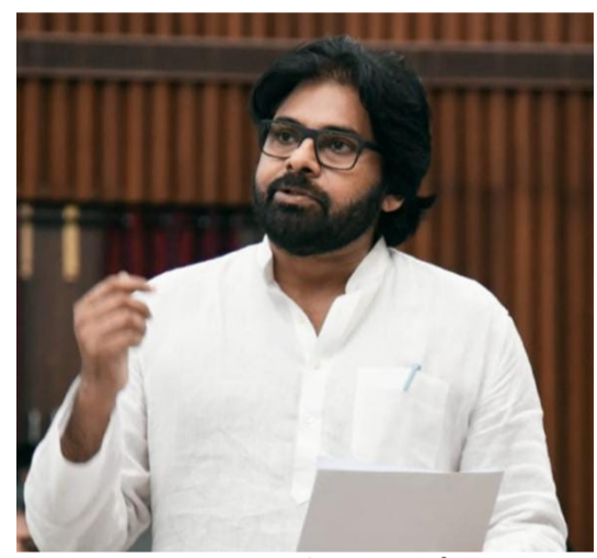
పైనా చర్చించారు. ఈ రెండు జీవ నదుల శుద్ధీకరణపైనూ దృష్టి పెట్టాలని, ఈ అంశంపై కూలంకషంగా సమీక్షించాలని ఉప ముఖ్యమంత్రి అధికారులకు దిశానిర్దేశం చేశారు.

రాష్ట్రంలో కాలుష్య నియంత్రణపై ప్రత్యేక డ్రైవ్ చేయాలని... అందులో భాగంగా పాల్యూషన్ ఆడిట్ కచ్చితంగా చేపట్టాలని రాష్ట్ర ఉప ముఖ్యమంత్రి, పర్యావరణ అటవీ, శాస్త్ర సాంకేతిక శాఖల మంత్రి పవన్ కళ్యాణ్ ఆదేశించారు.