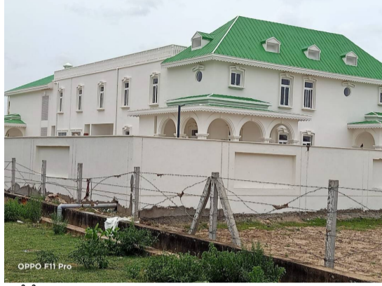
వైసీసీ కార్యాలయంపై ప్రభుత్వం దృష్టి సారించినట్లు సమాచారం. ఎన్టీఆర్ సీఎం హయాంలో పోలీసు కుటుంబాల సంక్షేమం కోసం క్వార్టర్స్ నిర్మించారు...