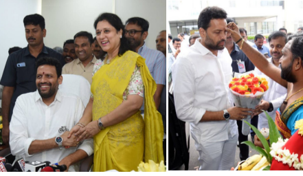
రాష్ట్రానికి తరలి వచ్చేలా రాష్ట్రంలో పరిశ్రమల ఏర్పాటుకు అనువైన వాతావరణాన్ని కల్పిస్తామన్నారు.