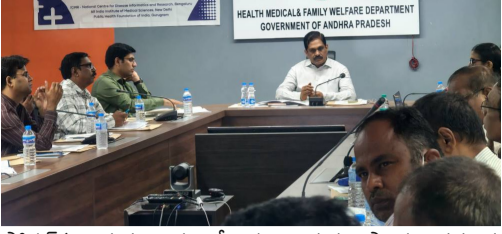
పోర్టల్కు అనుసంధానం చేశారని ఆయన చెప్పారు. ప్రపంచ ఆరోగ్య సంస్థ మార్గదర్శకాలకనుగుణంగా మరణాలకు సంబంధించి కచ్చితమైన కారణాన్ని నమోదు చేసేలా ప్రాథమిక ఆరోగ్య కేంద్రాల మెడికల్ ఆఫీసర్లకు శిక్షణ ఇస్తున్నామన్నారు