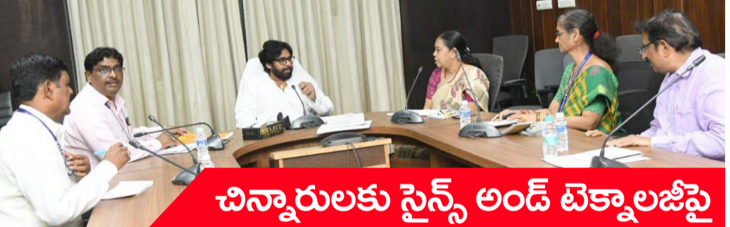
చిన్నారులకు సైన్స్ అండ్ టెక్నాలజీపై

మెడికల్ కాలేజీ పనిల కోసం మట్టి పర్మిట్ తీసుకున్నది గోరంత అయితే అక్రమంగా మట్టిని తరలిస్తున్నది మాత్రం కొండంత అని, ఇలాగే ఎల్.ఎం.డి నుండి అక్రమంగా మట్టిని తరలిస్తున్న విషయంలో సదరు దళారులు, కాంట్రాక్టర్, ఎన్.ఆర్.ఎస్.పి అధికారులపై చట్టపరమైన చర్యలు తీసుకోవడమే కాకుండా మట్టి దండాను తక్షణమే నిలుపుదల చేయాలని, లేనిపక్షంలో విజిలెన్స్ అధికారులకు ఫిర్యాదు చేస్తామని, లేనిపక్షంలో కోర్టులను ఆశ్రయించి బీజేపీ ఆధ్వర్యంలో న్యాయ పోరాటం చేస్తామని బీజేపీ రాష్ట్ర నాయకులు బీటె మహేందర్ రెడ్డి హెచ్చరించారు.