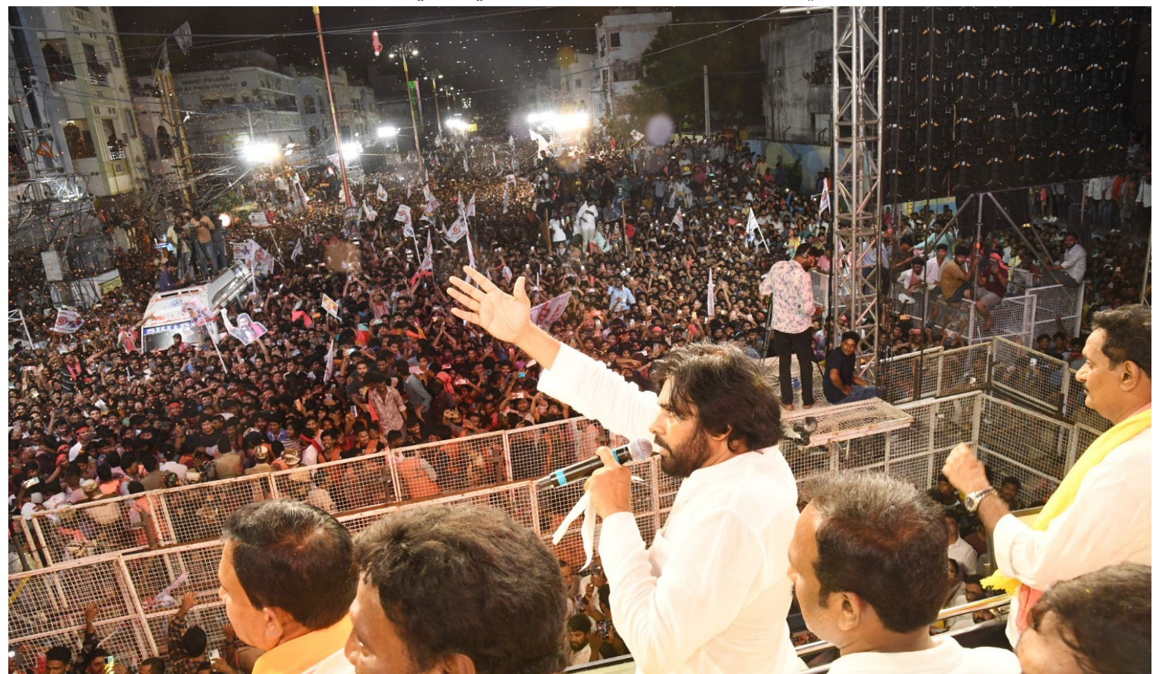
నెట్టుకురావడం సాధ్యమేనా..? దీన్ని యువత ఆలోచించాలి.

కాపు రిజర్వేషన్లను సైతం రాష్ట్రంలో 1950 తర్వాత తీసేశారు. వారు కూడా రిజర్వేషన్లు కోరుతున్నారు. సమాజంలో ప్రతి ఒక్కరూ బాగుండాలంటే మొదట వారికి ఉపాధి చూపించాలి. అసలు ఉపాధి, ఉద్యోగాలు తీయని జగన్ రిజర్వేషన్ కోసం మాట్లాడటం విద్వంసంగా ఉంది. వాలంటీర్ల ఉద్యోగం ఇస్తున్నానని జగన్ చెబుతున్నాడు. రూ.5 వేలతో కుటుంబాలను