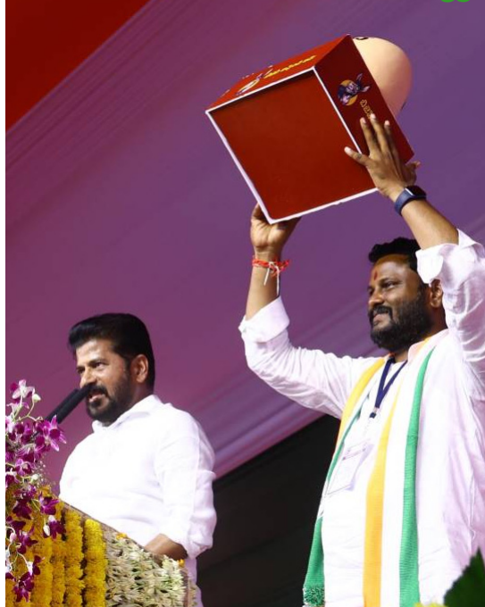
వ్యాఖ్యలు చేసిన బీజేపీ నేతలపై ఎన్నికల అధికారులు కేసులు పెట్టాలి. బీజేపీ తెలంగాణకు ఇచ్చింది గాడిద గుడ్డు తప్ప మోడి తెచ్చింది ఏమీ లేదన్నారు. ఆ పార్టీకి కర్రు కాల్చి వాత పెట్టాలని పిలుపునిచ్చారు.

ఈ విశ్వ నగరంపై బీజేపీ విషం చిమ్ముతోంది. మతం చిచ్చుపెట్టి ఎన్నికల్లో ఓట్లు దండుకోవాలని చూస్తోంది. తెలంగాణ సమాజానికి విజ్ఞప్తి చేస్తున్నా బీజేపీ ఉచ్చులో పడొద్దు. దేవుడు గుడిలో ఉండాలి.. భక్తి గుండెల్లో ఉండాలి. మత విద్వేషాలు రెచ్చగొట్టే