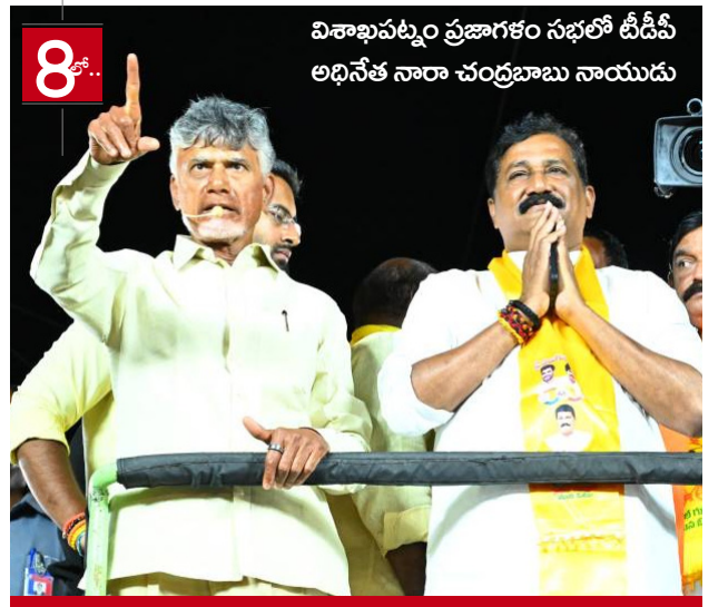
జైల్లో నన్ను చంపే కుట్ర చేశారు

డిజిటల్ న్యూస్ పేపర్ || శుక్రవారం 10, మే 2024 || ఎడిటర్ : మార్తా సుబ్రహ్మణ్యం