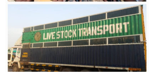
నడువుతూ కాసుల కోసం ఖాకీలు ఎదురుచూస్తున్నారు. మరోవైపు మూగజీవాల వేదన అరణ్య రోదనగా మారింది.