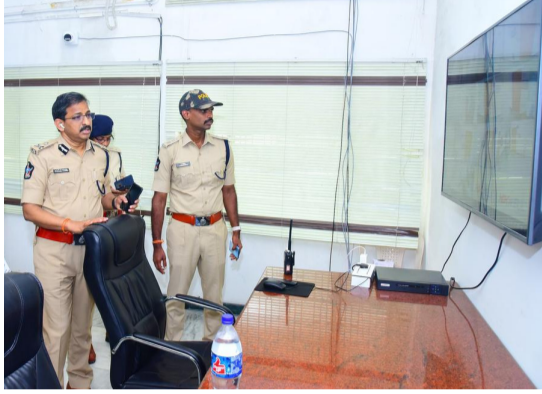
పేల్చే అనుమతి లేని కారణంగా అవి విక్రయించే షాపులకు నోటీసులు ఇచ్చినట్లు తెలిపారు. స్ట్రాంగ్ రూమ్ ప్రాంతాన్ని రెడ్ జోన్ గా ప్రకటించామని, డ్రోన్స్ ఎగురవేస్తే చర్యలు తప్పవని హెచ్చరించారు.

స్ట్రాంగ్ రూమ్ లు దగ్గర భారీ బందోబస్తు ఏర్పాటు చేశామని పోలీస్ కమిషనర్ పి.హెచ్.డి.రామకృష్ణ తెలిపారు. పోలింగ్ సమయంలో ప్రశాంత వాతావరణంలో ఎన్నికలు జరిగాయని వివరించారు. రెండు సీఆర్ పీఎఫ్, ఆర్వీడీ పోలీసులు సుమారు 400 మంది పోలీసు బందోబస్తు విధుల్లో ఉన్నారని తెలిపారు. స్ట్రాంగ్ రూమ్ లోకి అనుమతి ఉన్న వారిని మాత్రమే అనుమతి ఇస్తామని, షేషియల్ కెమెరాల ద్వారా స్ట్రాంగ్ రూమ్ లకు వచ్చే వారిని గుర్తిస్తున్నామని తెలిపారు. వీడియో గ్రఫీ తప్పనిసరిగా ఏర్పాటు చేసామని, స్ట్రాంగ్ రూమ్ ల వద్ద సీసీ కెమెరాలు లు ఏర్పాటు చేసినట్లు చెప్పారు. జిల్లాలో సెక్షన్ 144 అమలులో ఉంది. కర్రలు, మారణాయుధాలతో తిరగరాదని, బాణాసంచా