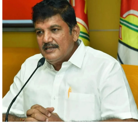
ఎవరు ఎవరిపై దాడి చేశారో వీడియోలు లేవా, స్థానిక ప్రజలు చెప్పడం లేదా..! బద్దెళ్ల నుంచి వైసీపీ

రౌడీలు, గూండాలు చెలరేగిపోతున్నారు. ఇప్పుడు ధీకారం కోల్పోతున్నామన్న అక్కసుతో దాడులతో చెలరేగి పోయారు. ఎన్నికల్లో ఎలాగైనా గెలవాలని ఓటర్లను భయభ్రాంతులకు గురి చేశారు. అయినా ప్రజలు వైసీపీని, జగన్మోహన్ రెడ్డిని ఓడించాలనే కనితో అర్ధరాత్రి వరకు క్యూలో వేచి ఓటు వేశారు. ఓటమిని గ్రహించిన వైసీపీ నేతలు సాకులు చెప్పుకుంటూ ప్రతిపక్షాలు, పోలీసు అధికారులపై తప్పుడు ఆరోపణలు చేస్తున్నారు. ఎల్లకాలం అబద్ధాలు, తప్పుడు ఆరోపణలతో ప్రజలను మోసం చేయలేరు అనే సంగతినీ గ్రహించి ఇకనైనా వైసీపీ నేతలు బుద్ధి తెచ్చుకోవాలి. ఇక వైసీపీకి ఓటమి అభ్యుదయ వైసీపీ నేతలు తెలుసుకున్నారు. అందుకే ఒక్క కర్నూలు ఒక్కో దేశానికి పారిపోతున్నారు. జూన్ 4 తర్వాత మిగిలిన వైసీపీ నేతలు కూడా రాష్ట్రం విడిచి పారిపోవడం ఖాయం.